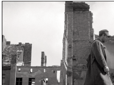
Figure 4 Irgendwo in Berlin (Gustav Lamprecht, 1946) © DEFA-Stiftung/Kurt Wunsch.