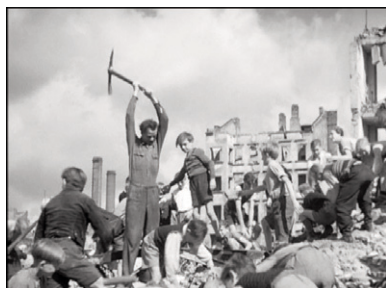
Figure 11 Irgendwo in Berlin (Gustav Lamprecht, 1946) © DEFA-Stiftung/Kurt Wunsch.

dernier plan le confirme. La trame réconciliatrice d' Irgendwo — où enfants et parents main dans la main reconstruisent l'Allemagne de demain (figure 11) — est à mille lieux de la solitude, du désespoir et du pessimisme fondateur du film de Rossellini 19 .