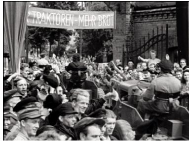
Figure 12 Unser täglich Brot (Slatan Dudow, 1949)

ruine, convertie en chantier, devient l'enjeu d'un combat idéologique duquel sortira vainqueur le nouvel ordre socialiste — l'état fournira des fonds et des tracteurs flambant neuf qui défileront dans la ville comme dans les films staliniens (figure 12). Force est de constater qu'il faudra attendre après la construction du Mur (1961) et le dégel en Union soviétique pour que le passé puisse être abordé de manière différente, tant politiquement qu'esthétiquement.