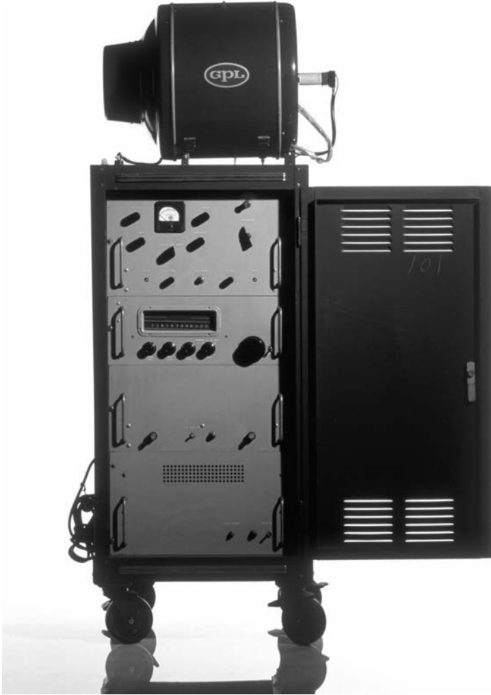
Récepteur de télévision PB-611_A General Precision Laboratoires, États-Unis, 1957.

Ce récepteur était utilisé dans les théâtres et permettait à plusieurs personnes de regarder la télévision ensemble.