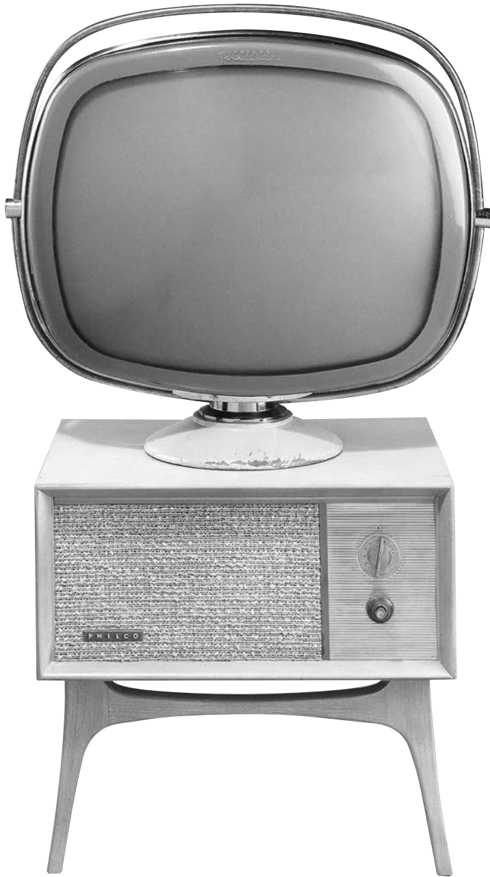
Téléviseur Predicta G4710 Tandem Console 21 Philco, États-Unis, 1958.