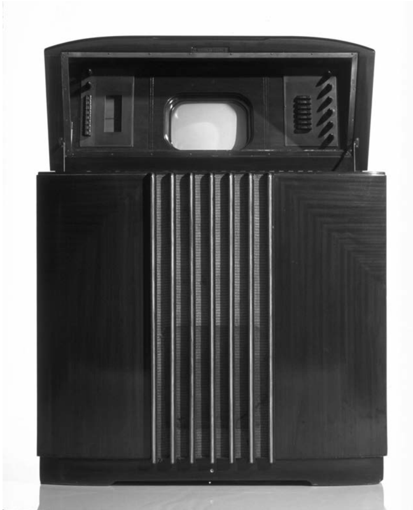
Télévision bHM275 Musaphonic General Electric, États-Unis, 1939.