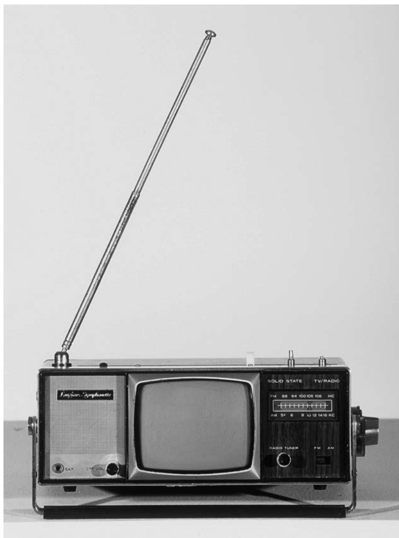
Téléviseur portable Adventure All Channel LTV-97 Longine Symphonette Society, Japon, env. 1970.