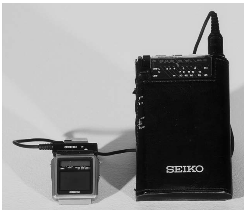
TV Watch Seiko, Japon, 1983.