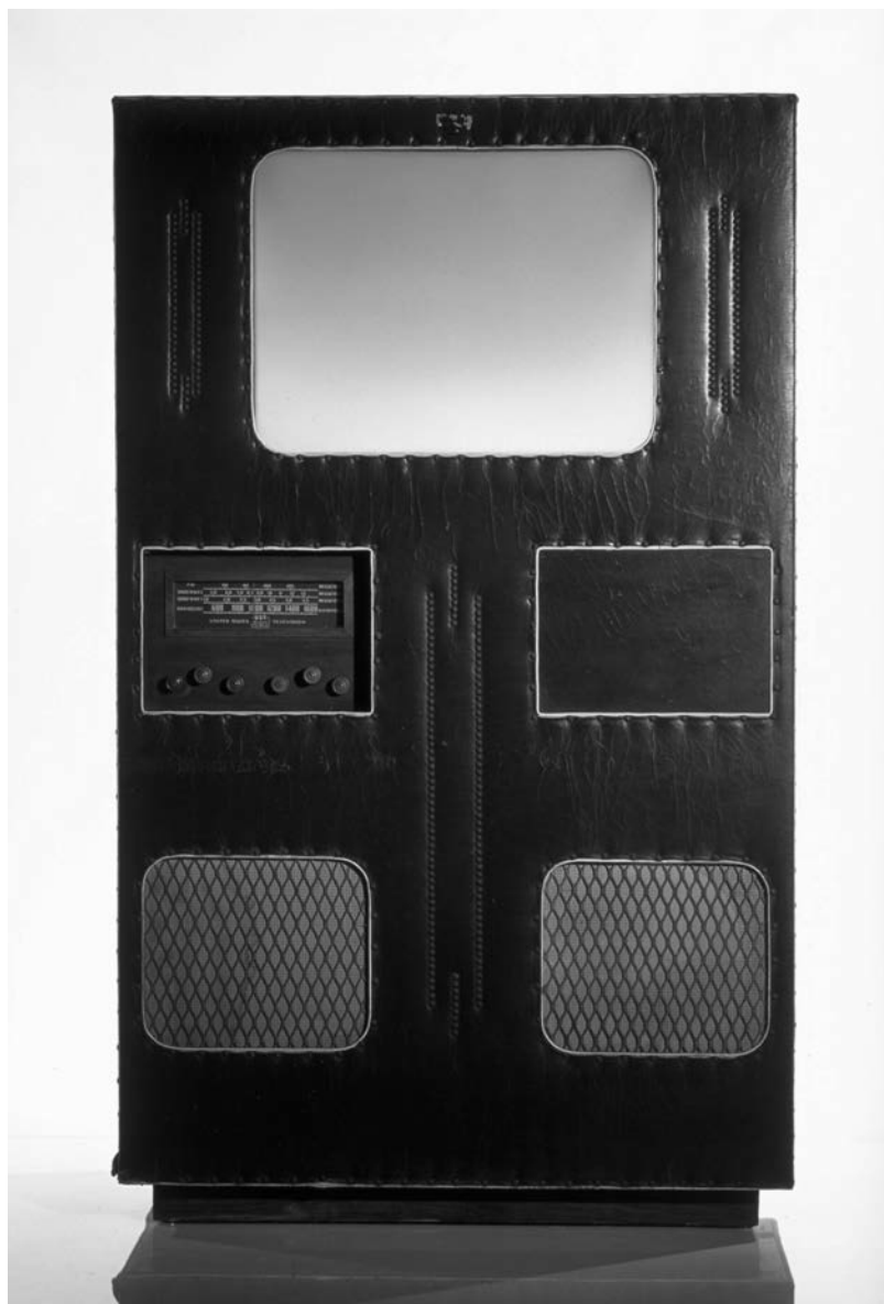
Téléviseur AC-70001 United States Television, États-Unis, 1947.