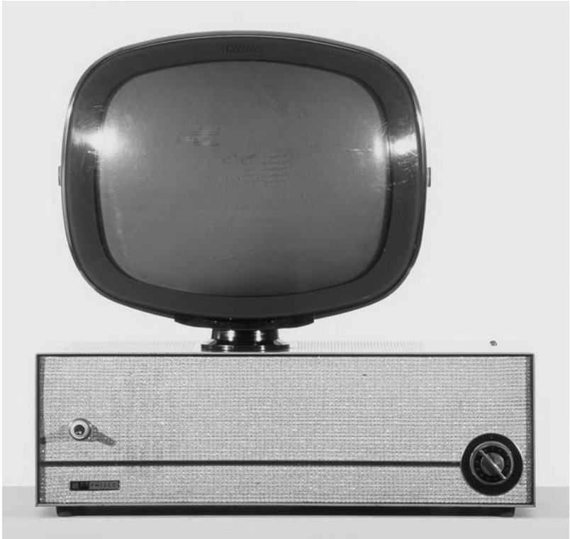
Téléviseur Predicta 3408 Debutante Philco, États-Unis, 1959.