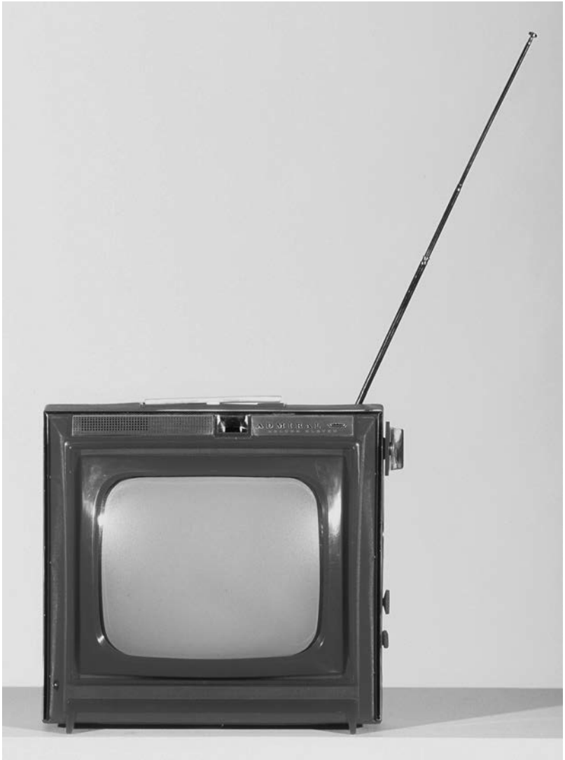
Télévision Deluxe Eleven Admiral, Canada, 1960.