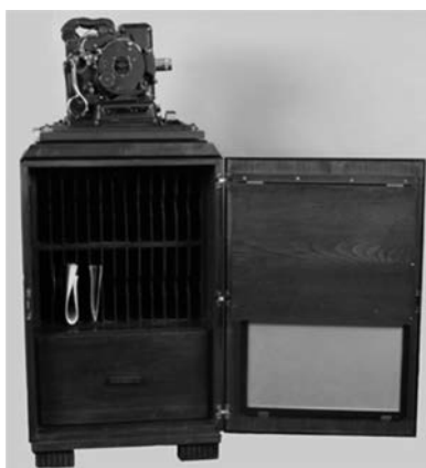
Meuble Kodascope Library avec projecteur 16 mm Kodascope model B, Eastman Kodak Company, États-Unis, env. 1930.