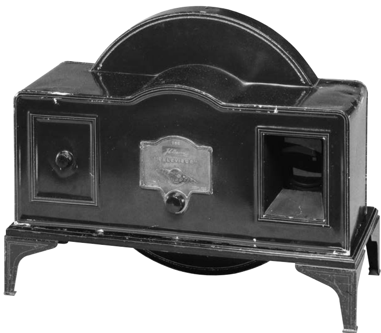
Téléviseur mécanique Televisor Baird, Grande-Bretagne, 1930.