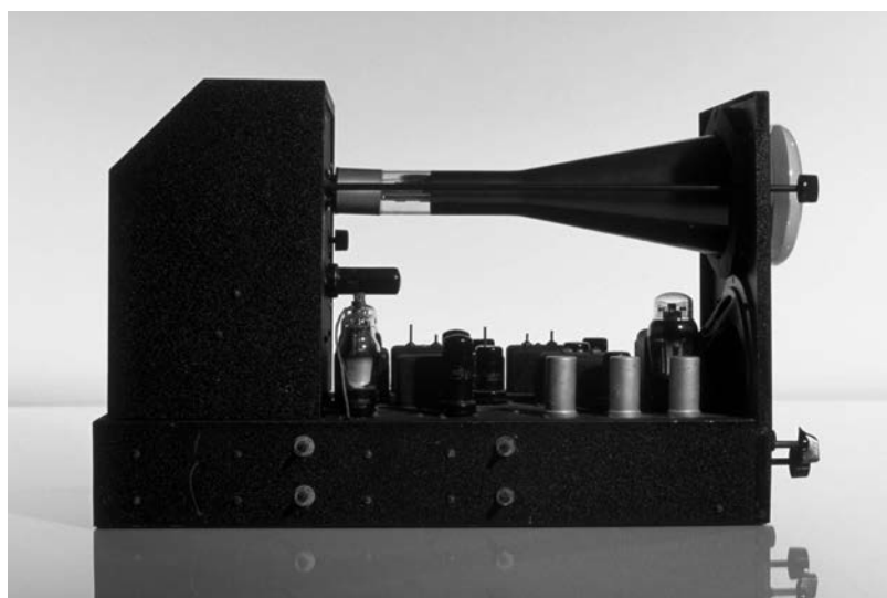
Télévision électronique en kit 10-1153 Meissner, États-Unis, 1939.