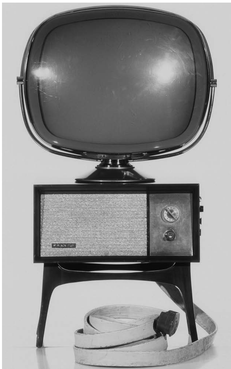
Téléviseur Predicta G4710 Tandem Console 21 Philco, États-Unis, 1959.

Le gros câble permet de relier une télécommande au téléviseur.