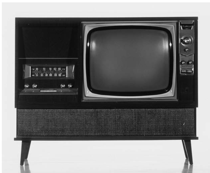
Télévision Model 23-613 Fleetwood, Canada, 1961.