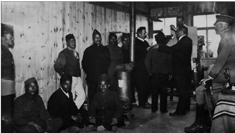
Figure 6 : The Halfmoon Files (Philip Scheffner, 2007).

idée de l'archive générale, au sens où l'entend Sekula, en réunissant des archives territorialisées mais interdépendantes sur le plan sémantique : l'un fait entendre les voix de prisonniers originaires de l'Inde, l'autre la voix de l'empereur Guillaume II. La dimension spectrale de ces voix sans corps se transforme au cours du film en une sorte de survivance résistante (au sens de Yerushalmi), grâce à une ouverture sur des espaces de sensations faisant surgir le non-synchrone, la déviation, l'interruption, le trouble. « L'imprévu n'est pas désiré », explique le commentaire