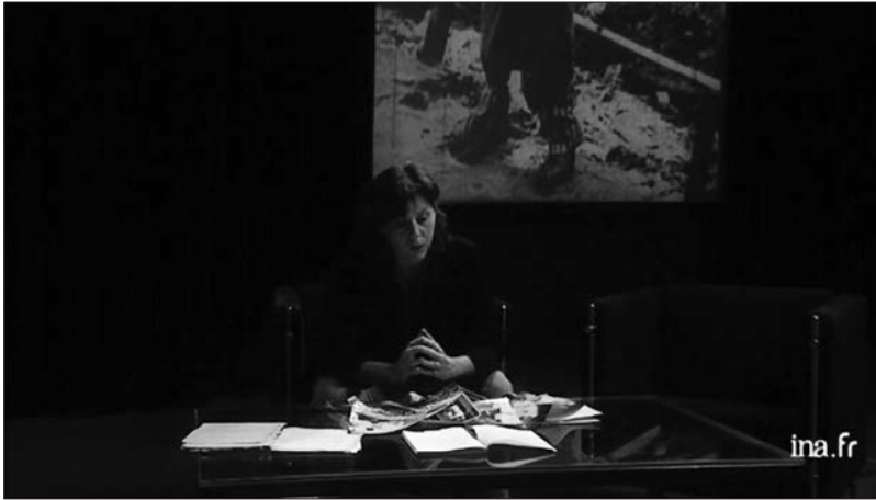
Figure 4 : Face aux fantômes (Jean-Louis Comolli et Sylvie Lindeperg, 2010).

« bouche des trous » (ainsi Veyne qualifie-t-il la tâche de l'historien) tout en essayant de trouver une forme artistique.