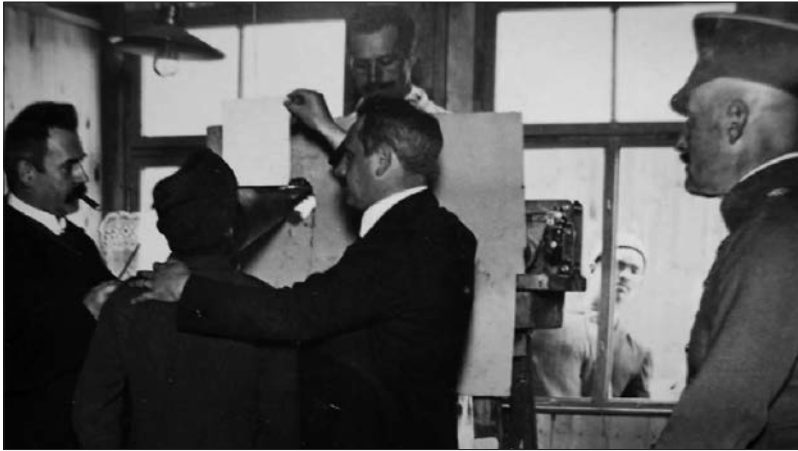
Figure 5 : The Halfmoon Files (Philip Scheffner, 2007).