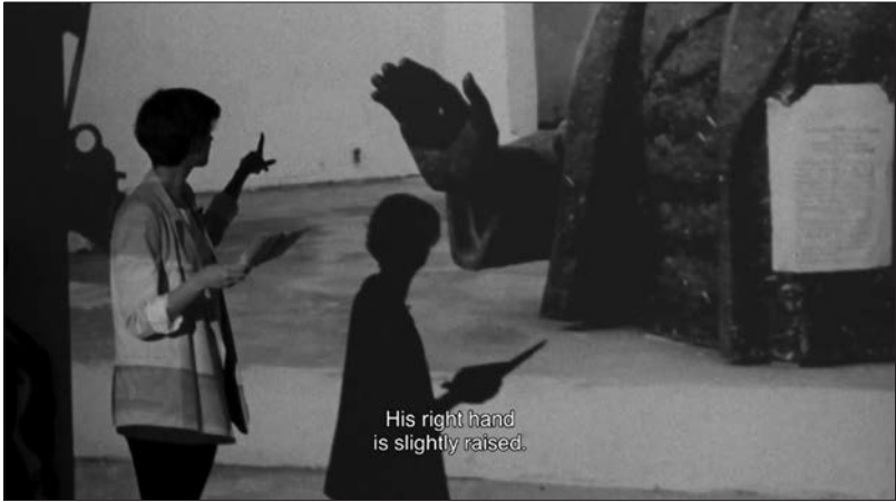
Figure 1 : Cacheu (Filippa César, 2012).

film de César présente des plans de cet ancien fort où sont rassemblées ces statues « mortes-vivantes », vestiges de l'âge colonial et signes de la condition postcoloniale, qu'il confronte à des traces de leur « vie » antérieure. Ainsi voit-on les mains d'un archiviste guinéen feuilletant un album de photographies et s'arrêtant sur la statue de Teixeira Pinto, un général portugais particulièrement violent, montée sur un piédestal à son emplacement initial, ce qui suscite une autre phrase des Statues de Resnais-Marker : « Un jour, nos visages de pierre se décomposent à leur tour » (fig. 2).