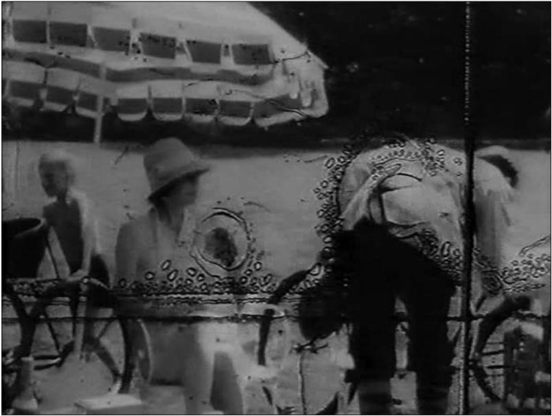
Figure 9 : Tren de Sombras (José Luis Guerín, 1997). © Films 59, Grupo Cine Arte et Institut del Cinema Català.

de Saint-Exupéry au cours d'une tout autre guerre. L'évocation d'une histoire possible passe souvent tout d'abord par la bande-son. Un exemple récent en est Rédemption (2013) de Miguel Gomes, dédié sans doute pour cette raison à Raúl Ruiz et à Chris Marker. Cette fable en quatre chapitres correspondant à quatre voix off associe un montage hétéroclite d'images frappantes ( Schlagbilder ) provenant d'actualités filmées à des fragments de films de famille et à des extraits de films de fiction : mélange transgénérique soumis à une logique diachronique. Rédemption situe ces récits dans quatre pays européens, à quatre moments différents de l'histoire. On ne comprendra les entrelacs énigmatiques de ces confessions que grâce aux dates qui apparaissent au générique de fin avec les noms des personnalités historiques à qui sont attribués ces souvenirs fabulés. Il y a aussi des cinéastes qui inventent des images d'archives pour mieux en exposer l'attrait. Ainsi le film onirique Tren de sombras ( Le spectre de Thuit , 1997) de José Luis Guerín — le titre, « Train d'ombres », s'inspire du fameux texte de Gorki sur l'expérience inquiétante du cinématographe — crée-t-il des scènes muettes