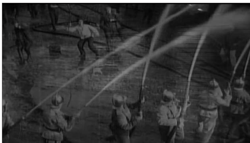
Figure 10 : Nocturnos (Edgardo Cozarinsky, 2011).