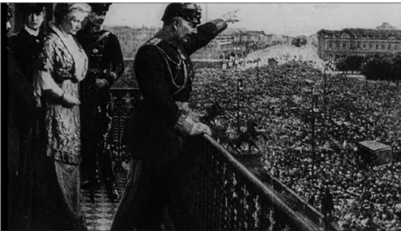
Figure 8 : The Halfmoon Files (Philip Scheffner, 2007).

Reliant deux temps et deux médias distincts, Scheffner met en relation trois régimes : le régime politique et symbolique de l'empereur qui, dans un élan de reconstitution, veut garder une trace de son discours inaugurant la Grande Guerre, même quand il devient clair qu'il va la perdre ; le régime technique qui permet de dissocier le temps initial de production de cette voix (sur le balcon du château) du temps de son enregistrement pour l'éternité ; enfin, le régime épistémique dans lequel s'ancre cette pratique, notamment par l'idée de la création d'un « musée des voix de tous les peuples » au moment même où s'invente « la Première Guerre mondiale ».