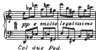
FIGURE 2. Alberto Ginastera, Sonata op. 22, Début du Presto misterioso 12

en général incapables. De l'avis général, la réponse aux besoins de l'Amérique latine serait un nouvel institut d'études avancées de composition. (King, 1985, p. 33) 13