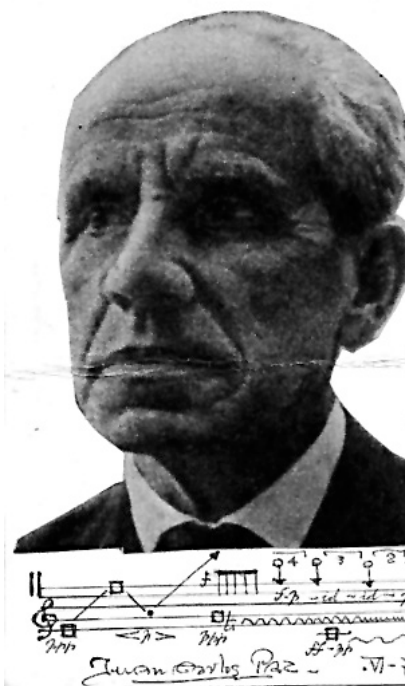
Juan Carlos Paz, Buenos Aires, juin 1971. Photo collée sur manuscrit, collection privée de Jorge Zulueta, Paris. A la fin de sa vie, Paz entretenait un rapport diagonal avec les nouvelles graphies, qu'il raillait volontiers, sans se priver de les utiliser pour ce qui sera sa dernière œuvre musicale, les Seis eventos de 1972.

Seule convenait à ses œuvres la musique athématique, atonale et amorphe ! C'est ainsi qu'il a commencé à pontifier, en se leurrant lui-même jusqu'à se prendre pour le continuateur de Schönberg et d'Alban Berg. Mais tandis que ces deux musiciens écrivaient des œuvres comme le mélodrame Pierrot lunaire ou le Troisième Quatuor op. 30, la Suite lyrique ou l'opéra Wozzeck , toutes des œuvres profondes et pleines de