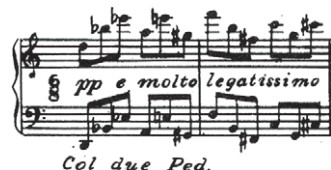
FIGURE 2. Alberto Ginastera, Sonata op. 22, Début du Presto misterioso 12

en général incapables. De l'avis général, la réponse aux besoins de l'Amérique latine serait un nouvel institut d'études avancées de composition. (King, 1985, p. 33) 13