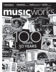
Musicworks , n° 100, « 30 Years », Toronto, printemps 2008.