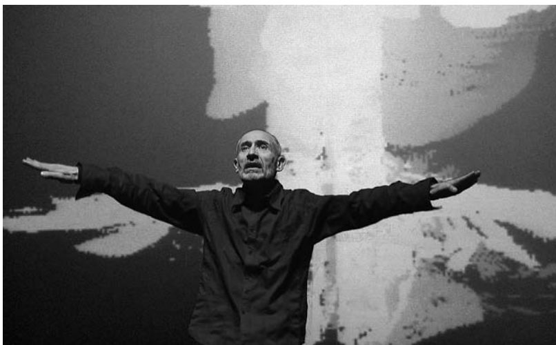
FIGURE 2 Light Music en concert : geste flash-cut