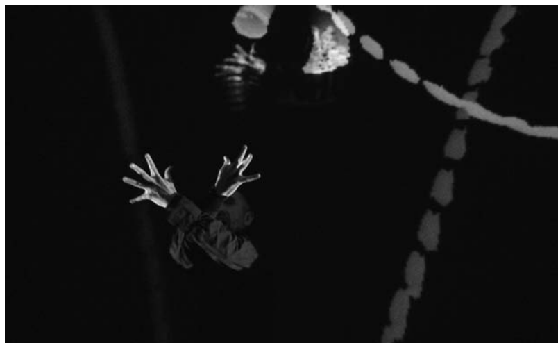
FIGURE 1 Light Music en concert : geste croisement-pentagone