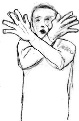
FIGURE 4 Light Music en croquis : geste croisement-effroi