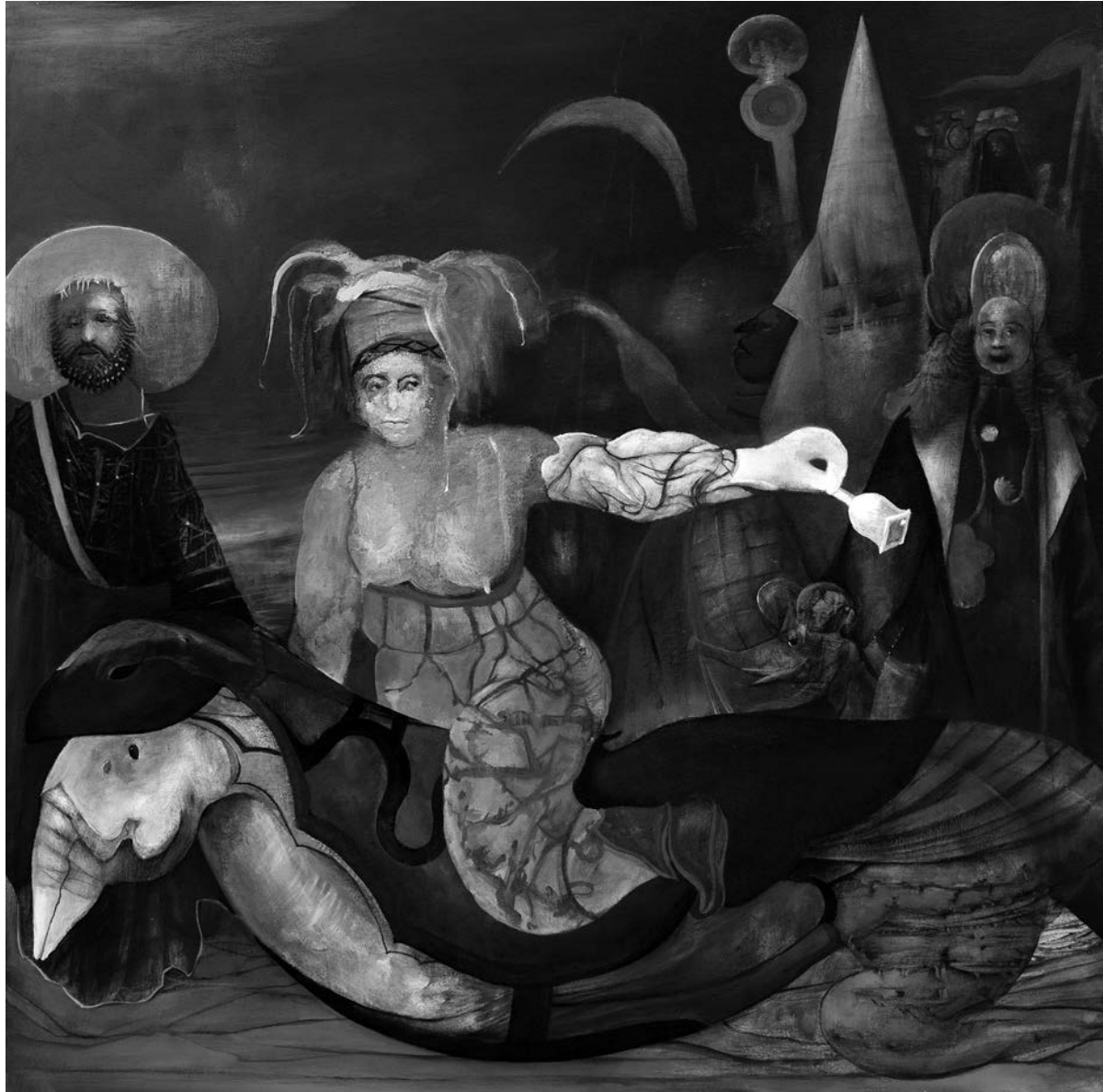
Jaber Lutfi, Le fou sonne le glas , 2008. Acrylique sur toile, 91 cm x 91 cm. Collection privée.