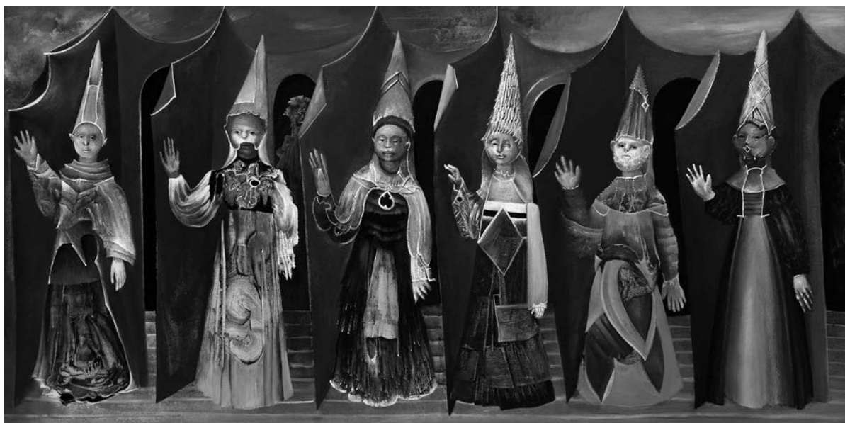
Jaber Lutfi, Répétition , 2012. Acrylique sur toile, 61 cm x 122 cm.