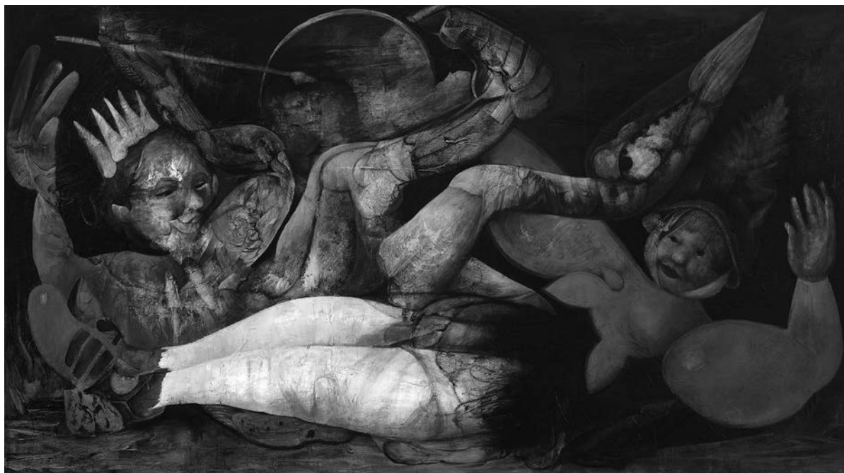
Jaber Lutfi, Fou et roi s'éveillent au jour , 2007. Acrylique sur toile, 76 cm x 137 cm.