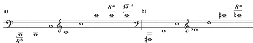
FIGURE 1 a) Cyclicité de la période traditionnelle reposant sur l'octave ; b) Espace non-octaviant reposant sur la cyclicité d'une période « contractée » de septième majeure.

15. Abordée en détail dans la seconde version du traité de Wyschnegradsky, Wyschnegradsky, 1996.