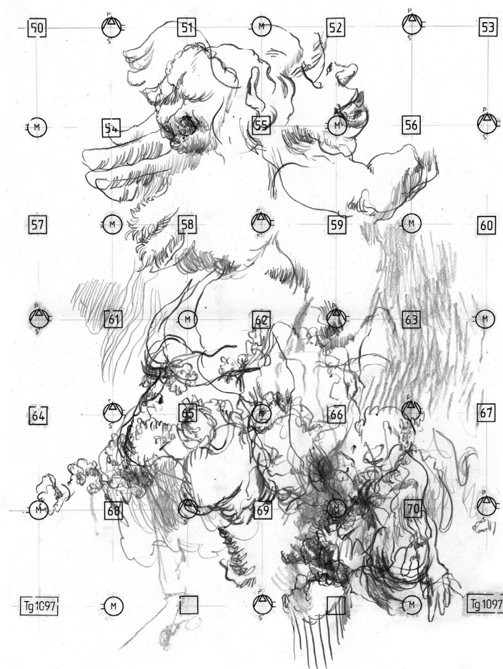
L. L. de Mars, sans titre, décembre 2019. Mine graphite sur papier, 30 × 40 cm.

21. Terme que je préfère généralement à « extra-musical ».