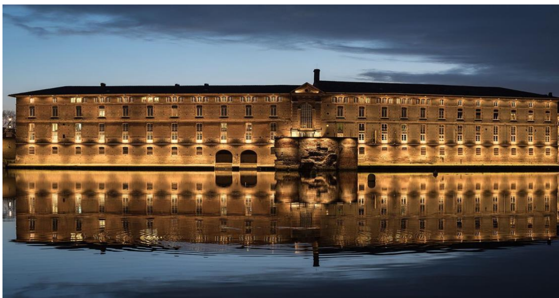
Figure 3 : L'Hôtel-Dieu de Toulouse, l'un des 64 monuments du bien 868, inscrit au patrimoine mondial de l'UNESCO, dit « chemins de Saint-Jacques-de-Compostelle en France »

d'accueil dans les villes et villages avec des haltes tous les trente kilomètres pour permettre l'essor et l'accueil des pèlerins. Il y a également en parallèle un enjeu politique qui est de valoriser l'image de Santiago de Compostella, et son incarnation iconographique Santiago Matamoros , figure mythique de la Reconquista espagnole. En 1257, les infrastructures qui bordent les chemins se renforcent avec la création des hôpitaux publics, dont l'Hôtel-Dieu de Toulouse (voir figure 3) est une construction emblématique. Ce monument est d'ailleurs inscrit au patrimoine mondial de l'UNESCO.