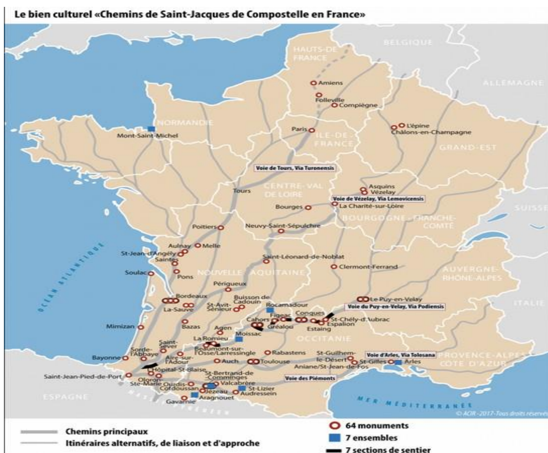
Figure 5 : Le bien 868 inscrit au patrimoine mondial de l'UNESCO