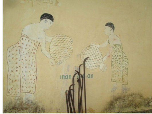
Figure 3 : Lieu de rituel des reines