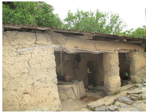
Figure 7 : case rituelle dédiée aux ancêtres