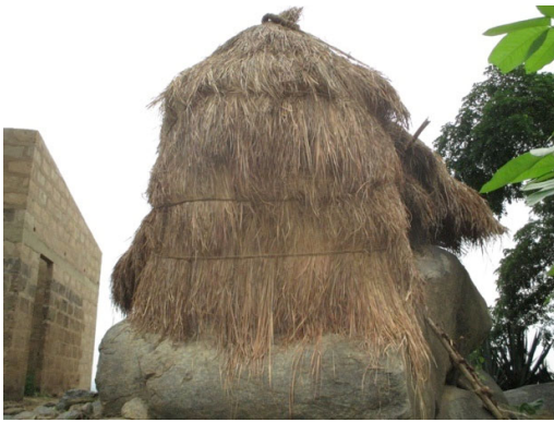
Figure 6 : case rituelle de JagouOgoudou

En guise de contribution, les femmes sont chargées quelques semaines avant la cérémonie de « Ilé ti toché » de la responsabilité de nourrir ceux qui vont travailler à recouvrir les toits. Le procédé du choix des femmes devant assumer la restauration s'appelle « Assériran », qui pourrait se traduire par « commande de mets ». Les dignitaires prennent quelques ingrédients du mets à commander et les apportent aux différentes personnes choisies. C'est ainsi que lorsqu'une personne reçoit quelques grains de maïs et qu'on lui dit « Aran è l'assé » (« tu as été choisie pour la restauration »), elle comprend qu'elle doit cuisiner un mets à base de maïs (akassa, pâte de maïs, etc.) pour la cérémonie. La stratégie du « Assériran » est un système traditionnel d'entraide pour mettre en œuvre efficacement les événements concernant toute la communauté. En réalité, la personne qui reçoit la mission du « Assériran » ne s'en charge pas seule, elle se réfère à toute sa famille et à ses proches pour obtenir leur contribution.