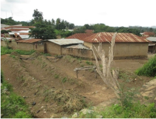
Figure 2 : Les trois sillons sacrés