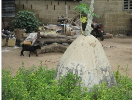
Figure 5 : site sacré du « Oossa », © B. Agbaka 2014