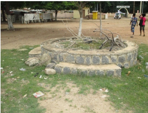
Figure 4 : « Idiwè Oyé », lieu où sont pratiqués les rituels de purification pour l'intronisation du roi ou des dignitaires