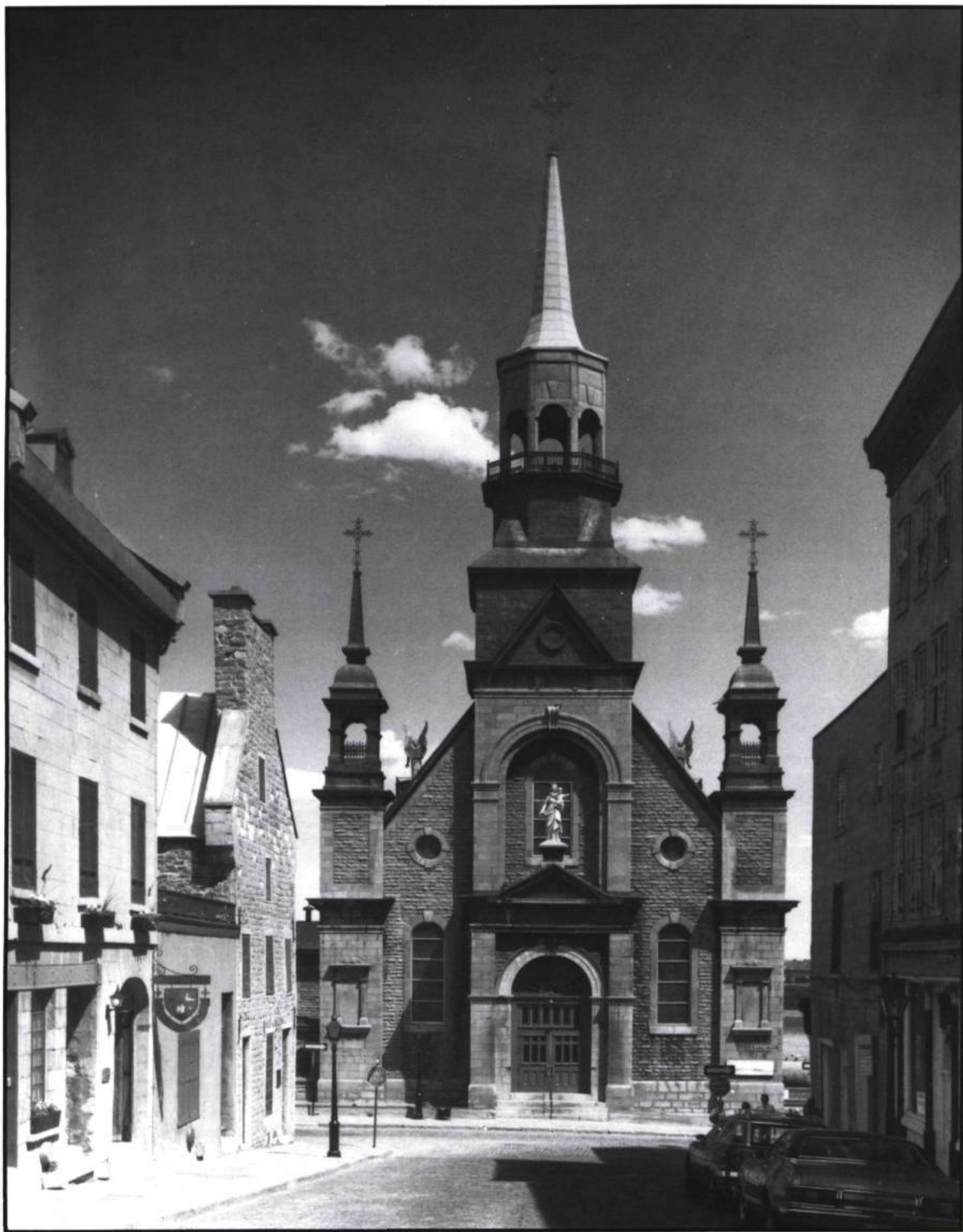
Menacée plusieurs fois, la conservation de l'église Notre-Dame-de-Bonsecours dans le Vieux-Montréal fut assurée à la fin du XIX e siècle mais les Sulpiciens y entreprirent des travaux de réfection qui en modifièrent radicalement l'aspect.