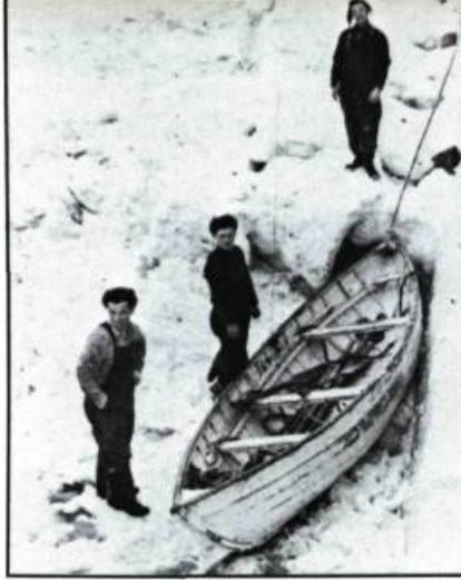
La traversée d'hiver à l'île-aux-Coudres, 1944-1945.

La question est de taille. Il y va de la pertinence d'une monumentale entreprise de conservation et de valorisation. Heureusement, toutefois, les raisons d'agir ne sont pas de moindre importance que les raisons justifiant l'inaction. Car celle-ci signifierait que l'on consent à abandonner à d'autres le rôle de maîtres d'oeuvre de nos exceptionnelles richesses marines.