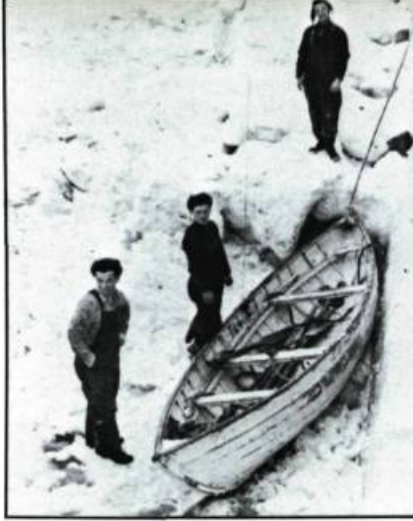
La traversée d'hiver à l'île-aux-Coudres, 1944-1945.

La question est de taille. Il y va de la pertinence d'une monumentale entreprise de conservation et de valorisation. Heureusement, toutefois, les raisons d'agir ne sont pas de moindre importance que les raisons justifiant l'inaction. Car celle-ci signifierait que l'on consent à abandonner à d'autres le rôle de maîtres d'oeuvre de nos exceptionnelles richesses marines.