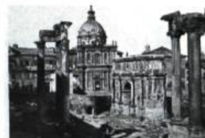
PHOTOGRAPHIE ET ARCHITECTURE 1839-1939