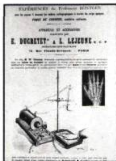
Catalogue de la maison Ducretet et Lejeune, célèbres fabricants de Paris, présentant les appareils nécessaires aux expériences sur les rayons X. Röntgen avait observé pour la première fois les rayons X en novembre 1895, soit à peine cinq mois avant la publication de ce catalogue. (photo: Archives du Séminaire de Trois-Rivières).

Et la recherche? Comment s'est constitué ce patrimoine? À quelles fins? Dans quel contexte? Ce sont là des questions fondamentales si l'on veut développer le plein potentiel des objets, des collections. Au rythme auquel progressent actuellement les connaissances québécoises dans ce domaine, il reste du travail pour des années encore.