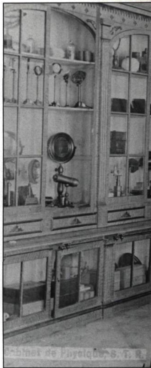
Le Cabinet de physique du Séminaire de Trois-Rivières au début du XX e siècle.

Nous tenons effectivement du passé un certain nombre de collec-