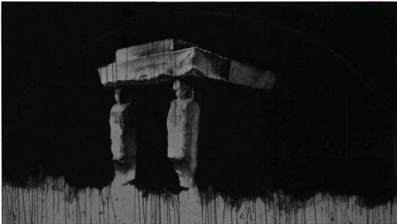
Paul Béliveau, Itinéraire, voyage à faire seul III , 1983. Crayon et acrylique sur papier Arche, collection Air Canada.

Réal Lussier est conservateur et responsable des expositions itinérantes au Musée d'art contemporain de Montréal. Il a conçu l'exposition Présent antérieur qui traite du thème de la mémoire dans l'art actuel.