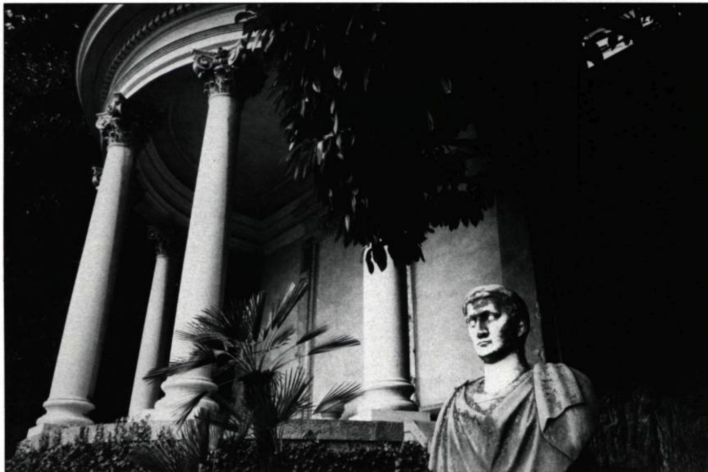
Marc Cramer, Sans titre, 1984. Épreuve sur papier aux sels d'argent.

L'intérêt que portent au passé les artistes d'aujourd'hui se manifeste donc de façons très diverses: l'attrait des vestiges en est une. Le travail d'un certain nombre d'artistes révèle en effet une fascination, ou tout au moins une préoccupation, pour les