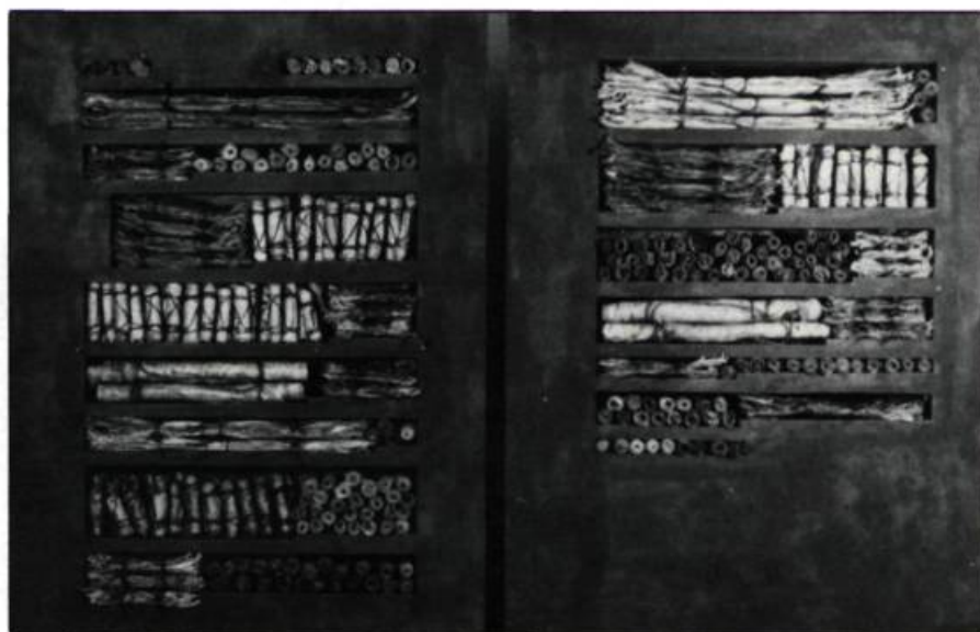
Bernard Rousseau, Translittérations I , 1985. Techniques mixtes.

Dans Fragments , ses derniers travaux, Linda Covit exprime une cer-