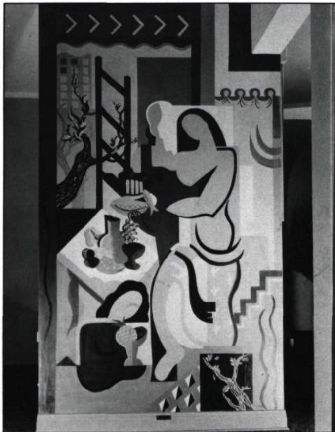
4. La murale décorant l'entrée de la même maison par Zette Boyer-Gagnon et Claude Hinton.

évolution: les meubles des élèves de Julien Hébert, qui commence à enseigner à l'École en 1948, reflètent ce changement.