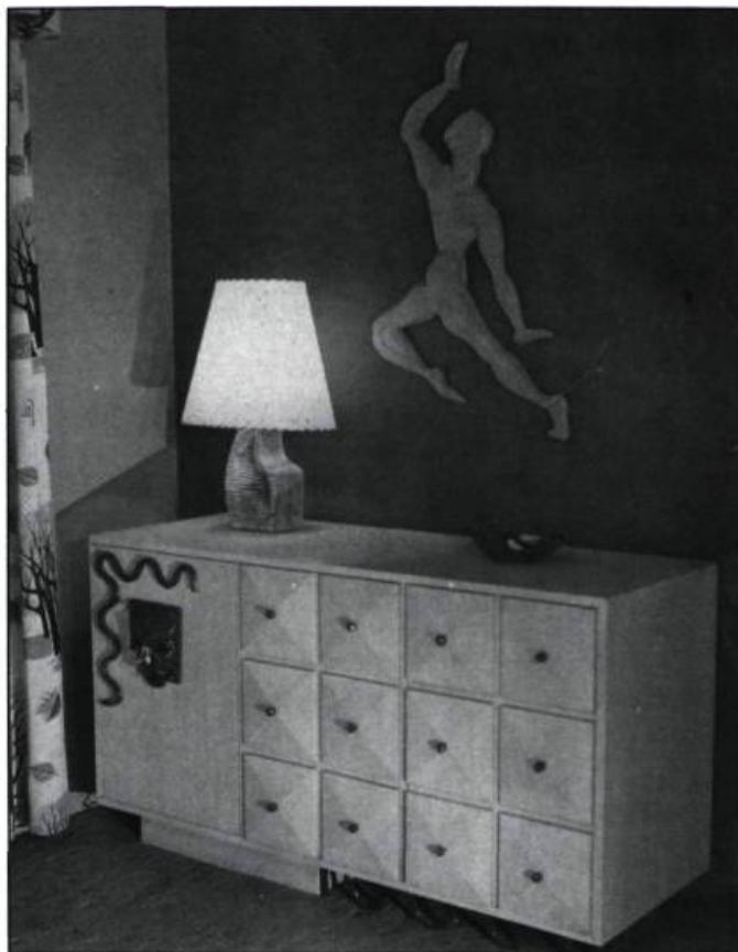
5. Commode et lampe conçues par Claude Hinton pour la maison d'Andrée Paradis vers 1948. Au mur, un relief conçu et réalisé par Hubert Boyer.

Les années cinquante voient le style international (Bauhaus) et le style scandinave s'implanter au Québec au détriment de l'Art déco, qui perd de plus en plus de popularité. Plusieurs facteurs favorisent cette nouvelle mode: la communication est devenue meilleure entre les concepteurs et l'industrie; les importations sont plus nombreuses; le marché des biens de consommation se développe. L'École du Meuble suit cette