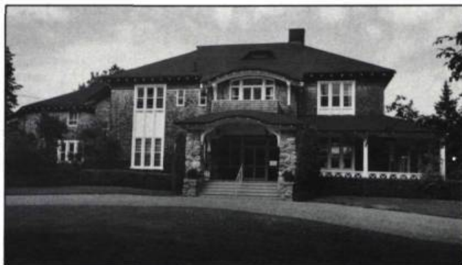
Résidence construite en 1910 par Edward W.S. Maxwell dans le «shingle style». On remarque les toitures en «Eye brow» (au galbe incurvé) typique de cet architecte. Les pelouses, à l'arrière, descendent jusqu'au bord de la mer.

Cent ans plus tard, lorsque Sir William Van Horne, directeur général de la Compagnie du chemin de fer Canadien pacifique, se retire des affaires, il achète Minister's Island , en face du village, entraînant à sa suite banquiers, hommes d'affaires et riches bourgeois en quête de villégiature. Après avoir construit la résidence de Sir William, Coven Howen, l'architecte Edward Maxwell 2 multiplie les grandes demeures dans le shingle style (c'est-à-dire à