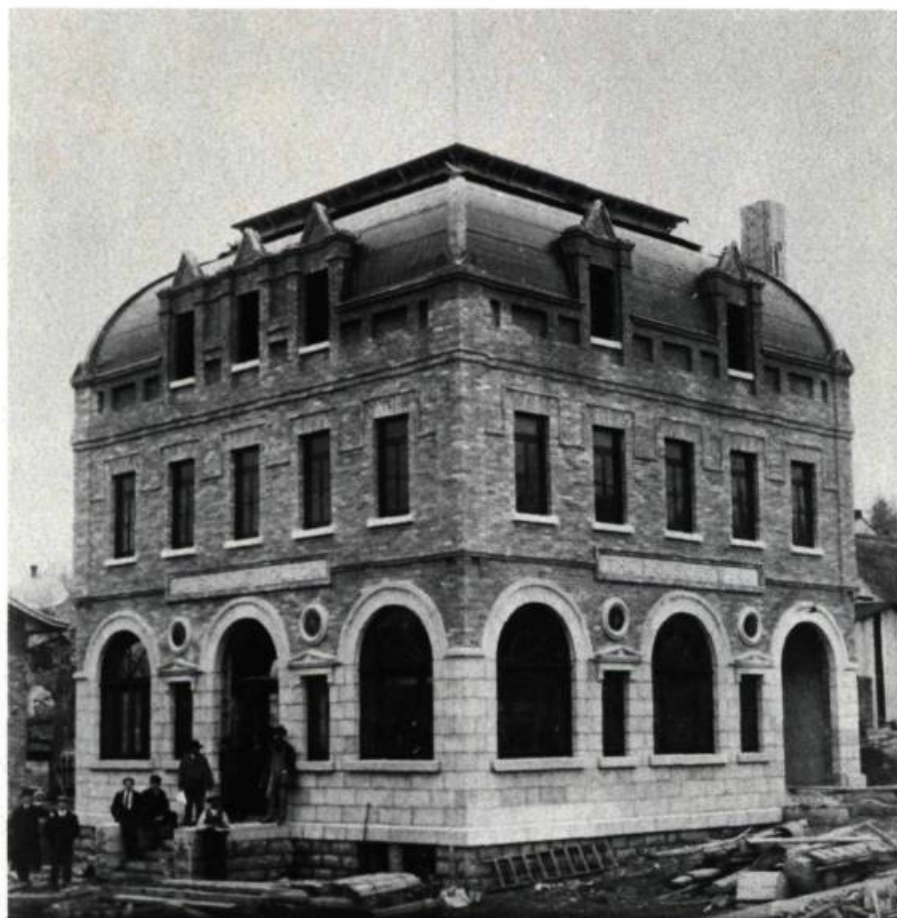
La banque Molson de Chicoutimi lors de sa construction en 1902 (René P. Lemay, arch.). Il ne subsiste aujourd'hui qu'une partie de la façade de ce somptueux édifice.

Un panorama de l'architecture au Saguenay-Lac-Saint-Jean.