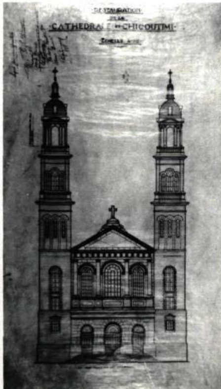
Restauration de la cathédrale de Chicoutimi en 1919 par Alfred Lamontagne, architecte.

Les Archives nationales du Québec conservent à leur centre du Saguenay—Lac-Saint-Jean plus de 15 000 plans et devis provenant de fonds privés d'architectes et d'ingénieurs de la région.