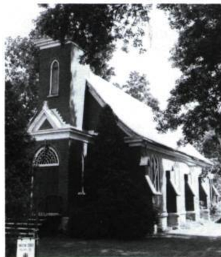
L'église anglicane St. Michael (1849), à Terrebonne, remarquable par son style composite.

composite. Au n o 1209, la maison Kimpton et Bakewell. «L'école anglaise» occupe le n o 1226 et la maison Maple Hall le n o 1303.