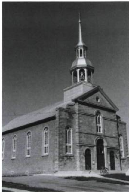
L'église Saint-Alexis (Victor Bourgeau, arch., 1856).

Sainte-Julienne. La préfecture de la MRC de Montcalm (26, rue Albert) loge dans un bâtiment exceptionnel. Construit en 1859 par un entrepreneur de Saint-Alexis, l'édifice devait abriter, outre le bureau d'enregistrement, une cour de circuit et le palais de justice. L'édifice en pierre des champs, qui emprunte à l'architecture domestique, a été classé monument historique.