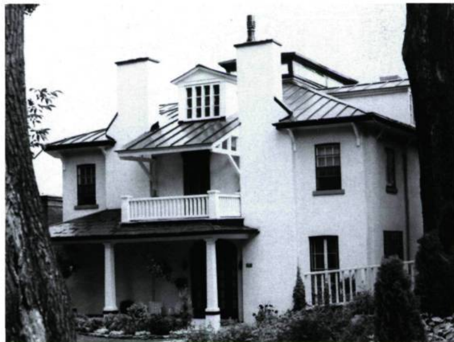
La ferme Outre-Mont, 221-223, McDougall (1833-1838).