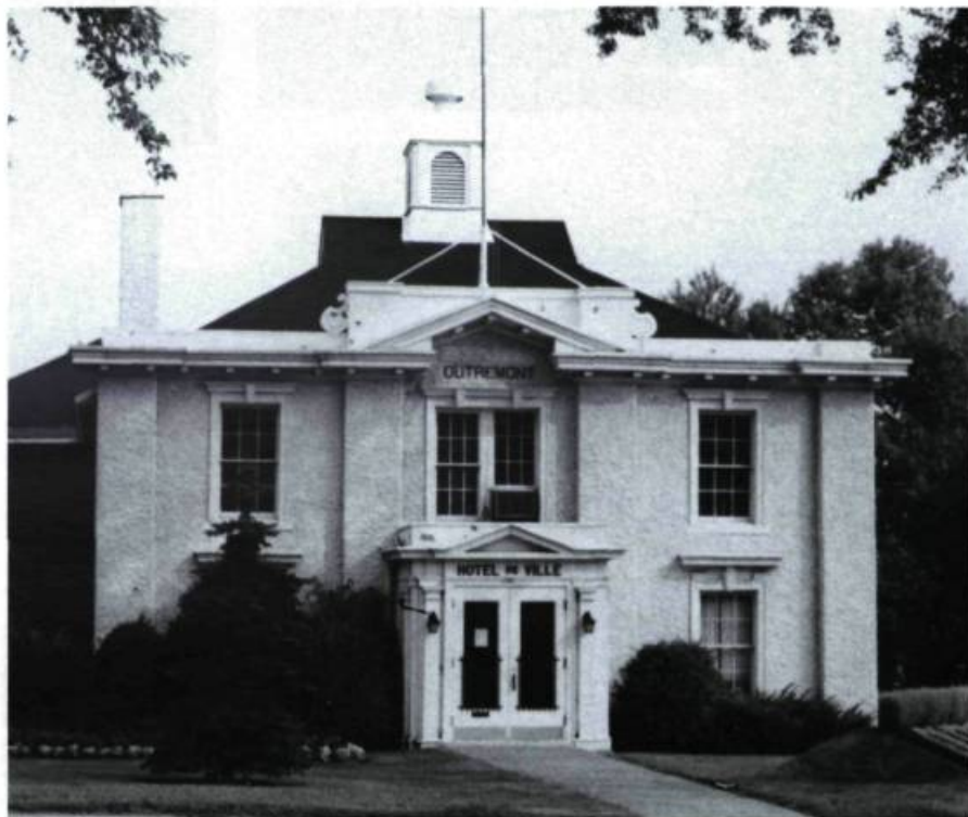
Hôtel de ville, 543, Côte-Sainte-Catherine (1817).

De l'autre côté (n° 543), l'hôtel de ville s'est installé dans la maison que Stanley & Abner Bagg avaient fait construire en 1817 et qui a aussi servi d'entrepôt à la Compagnie de la Baie d'Hudson, d'école et de prison. Le plus vieux bâtiment de la ville, il conserve malgré ses agrandissements la beauté de son ordonnance néo-classique et compose un ensemble pittoresque avec l'ancienne église presbytérienne qui depuis 1963 abrite la salle du conseil (n° 530, Davaar; J. E. Adamson, arch.; 1910).