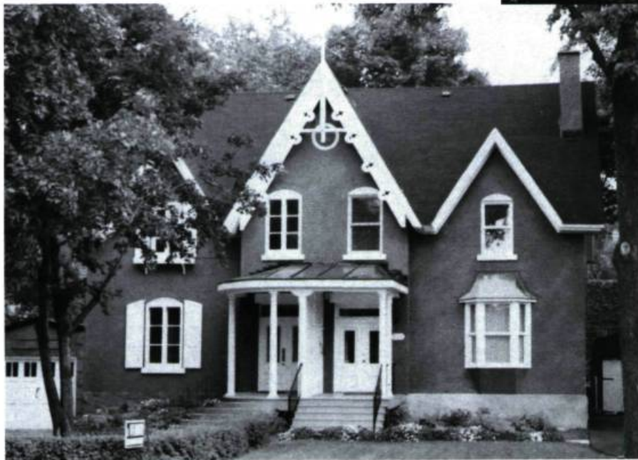
Maisons George E. Cooke, 708-710, Côte-Sainte-Catherine (v. 1874).