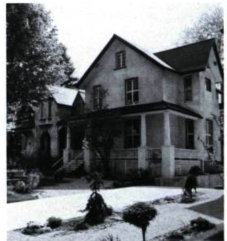
Woodside cottage, 792 A-B, Côte-Sainte-Catherine (v. 1860; agrandie en 1987; J. Béique et Ass., arch.).

En face, trois résidences présentent aussi une grande valeur patrimoniale. D'abord celle que J.-B. Aimbault a probablement fait construire vers 1820 (n° 637) et qui constitue aujourd'hui le seul exemple d'architecture rurale québécoise dans les limites de la ville. Ensuite sa voisine, la maison J.-P. Tremblay (n° 645; 1929), dont le toit à pentes raides est typique de la manière de l'architecte A. Beaugrand-Champagne. Enfin, à l'ouest de l'avenue Dunlop (n° 661), une habitation de brique rouge qui remonterait à 1894 et qui se rapproche, par ses proportions et par la composition rigoureuse de sa façade, de l'architecture géorgienne de la Nouvelle-Angleterre.