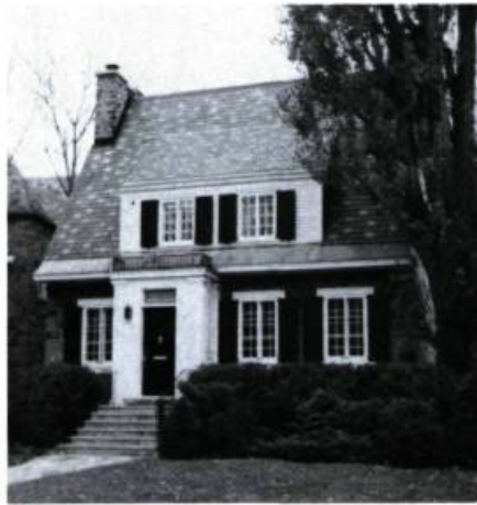
Maison J.-B. Aimbault, 637, Côte-Sainte-Catherine (v. 1820).