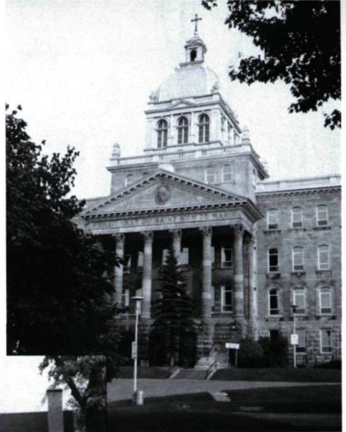
Pensionnat du Saint-Nom-de-Marie, 628, Côte-Sainte-Catherine (J.-B. Resther, arch.; 1903).