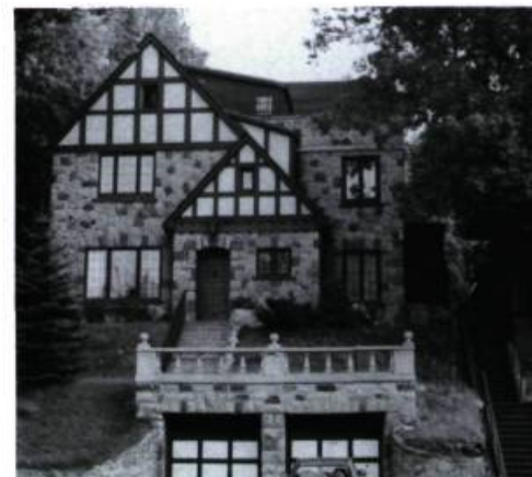
Maison Y. I. Fanaberia, 228, Côte-Sainte-Catherine (M. M. Kalman, arch.; 1937).

Un peu plus loin, la maison Taylor-Smith illustre l'attitude inverse. Ses propriétaires se sont en effet adressés à une agence de Grand Rapids (Michigan), qui a fourni les plans par correspondance. (n° 246; H. & J. H. Daverman, arch.; 1906).