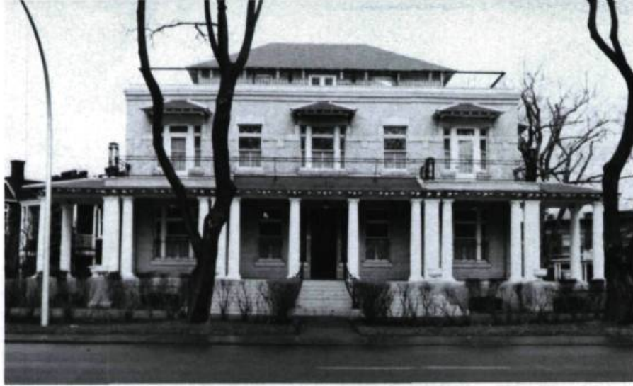
Maison Osias Lamoureux, 325, Côte-Sainte-Catherine (Doucet & Morissette, arch.; 1912).