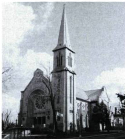
Église Saint-Germain, 696, Côte-Sainte-Catherine (David, Tourville & Perrault, arch.; 1930).

La maison Camille Legault (n° 557; MacDuff & Lemieux, arch.; 1912), dont on notera la belle tourelle d'angle à dôme d'inspiration Second Empire français, a malheureusement perdu sa galerie d'origine qui opérait le lien entre les parties de pierre et de brique.