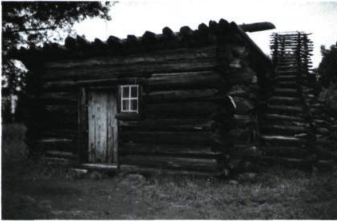
Habitation des pionniers à Upper Canada Village.