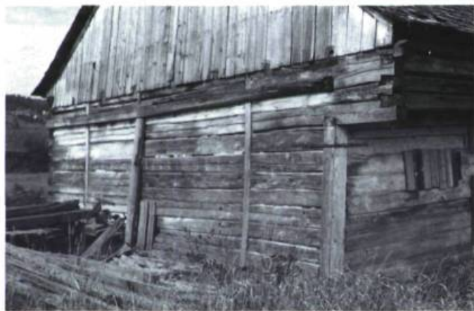
Belle grange de la région de Charlevoix en pièce sur pièce avec encorbellement et assemblage à queue d'aronde.

bousillage ou d'un torchis de boue et de paille, de glaise, de filasse de chanvre ou, à partir du XIX e siècle, d'étoupe et de mortier. Certains recouraient au badigeonnage annuel du carré à l'aide d'un lait de chaux afin de prévenir l'infiltration d'insectes et de rongeurs ou le développement de champignons. Toute la solidité du carré de charpente reposait sur la façon d'en assembler les angles. C'est pourquoi on retrouve, dans les pays où ce type de construction s'est répandu, plusieurs modes particuliers d'assemblage.