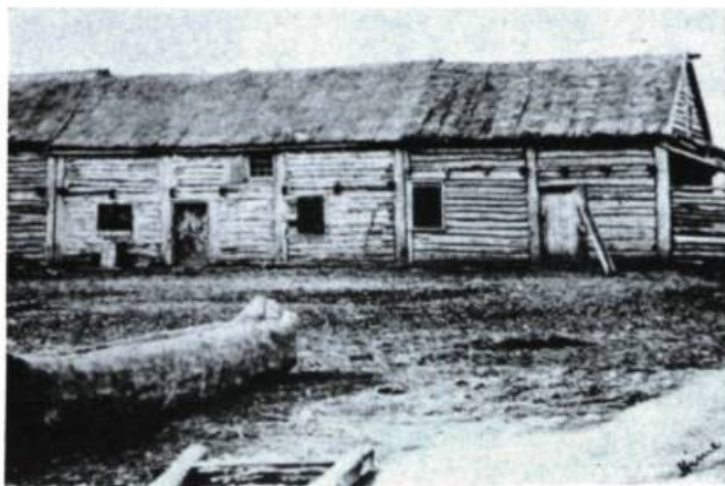
Une photographie ancienne illustrant le type de construction «poteaux à coulisse».

Pour rendre la construction étanche, on bouchait les interstices au moyen d'un