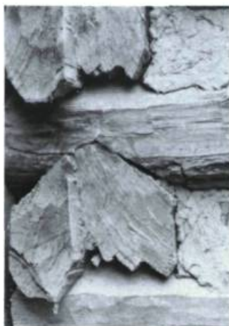
Détail d'assemblage illustrant la taille en A des extrémités des pièces pour bien chaîner les coins du bâtiment. Tirée de John I. Rempel.

Les constructions de bois demeurent vulnérables. Mais une conception soignée aux détails bien pensés, une inspec-