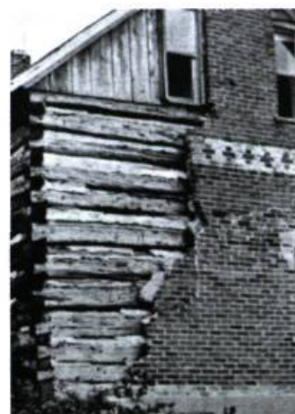
Sous un revêtement contemporain ou postérieur se révèle le carré ancien de la maison en pièce sur pièce. Tirée de John I. Rempel, Building with Wood , University of Toronto Press, 1980, 454 p.

Voyons en quoi consistait cette construction populaire typique. Au début de la colonie, on assemblait le carré à l'aide de pièces équarries insérées dans des poteaux rainurés; on taillait l'extrémité des pièces de telle sorte qu'elle glisse dans les rainures de poteaux verticaux. On appelait cette technique «poteaux sur