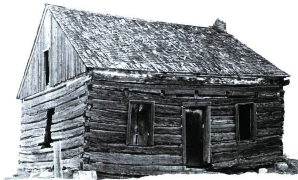
Ancienne demeure dans la région de Montréal composée de pièces de bois assemblées à queue d'aronde, qui laisse voir l'extrémité des solives du plancher de l'étage.

Qu'on les appelle maisons en rondins ou en pièce sur pièce, ces constructions de bois comptent souvent parmi les plus anciennes dans nombre de pays. Faites de matériaux locaux, elles sont associées à la création de nouveaux établissements humains. L'époque de la colonisation ou celle de la ruée vers l'or, par exemple, ont favorisé ce type d'habitat simple et peu coûteux qui puisait à même les ressources du milieu environnant.