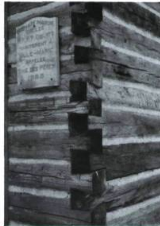
Première maison des pères oblats à Ville-Marie au Témiscamingue. Assemblage à queue d'aronde.

sote, soluble dans l'huile, a des limites... écologiques. Aussi le marché offre-t-il aujourd'hui des produits qui sont solubles dans l'eau. Propres, inodores et incolores, ils sont moins dommageables pour l'environnement. Ils acceptent de plus les enduits de finition, comme la peinture et la teinture. Parmi les plus connus, mentionnons le chromate acide de cuivre (CCA), l'arséniate de cuivre