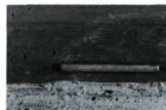
Un exemple de trous d'envol laissés par des insectes.

La présence d'eau dans le bois est le principal facteur responsable de la dégradation structurale des maisons en pièce