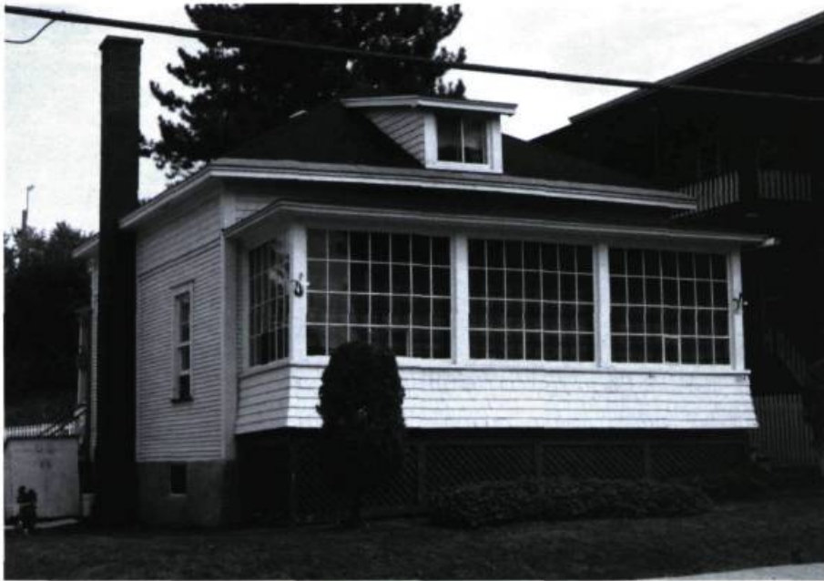
Maison unifamiliale: 224, rue du Parc, Sherbrooke. Photo: Richard Milot, 1988.

Dans les premières décennies du XX e siècle – comme en témoigne la maison de la rue du Parc, à Sherbrooke, et surtout comme son ancêtre hindou –, une véranda, sorte de porte vitrée, s'ajoute à la maison unifamiliale. L'orientation sud-ouest de la véranda lui vaut plus tard l'appellation de solarium.