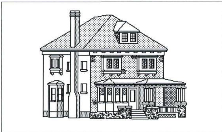
Schéma d'une maison vernaculaire avec toit en croupe: 243, boulevard Queen Nord, Sherbrooke. Infographie: Gaétan Bousquet, 1988.

La maison unifamiliale naît d'une rationalisation des formes en fonction des besoins modernes au tournant du XX e siècle, qui réduit la maison à une simple unité composée d'un rez-de-chaussée où tout est de plain-pied. Même si elle dérive indirectement de l'unifamiliale hindoue, celle du Nord-américain est somme toute un modèle réduit des villas californiennes au début du XX e siècle. Elle s'inscrit ensuite au sein d'un mouvement de construction d'habitations populaires nommé craftman (artisan-bricoleur). Des plans précis, issus pour leur part des premiers pattern books , sont mis en vente par des maisons spécialisées telles Alladin. Cette rationalisation marque un pas vers la normalisation, qui conduit à la fabrication usinée des années 70 ou au concept de modules évolutifs des années 90.