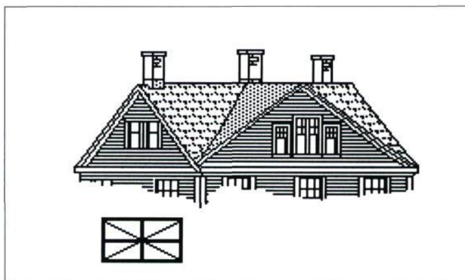
Schéma d'une maison vernaculaire à pignon central et configuration de ses lignes de toit: boulevard Queen Sud, Sherbrooke. Infographie: Gaétan Bousquet, 1987.

La maison munie d'un toit en croupe s'avère la forme la plus populaire après celle du pignon. Elle se caractérise par un plan simple (non articulé) – carré ou rectangulaire – d'une élévation de forme cu-