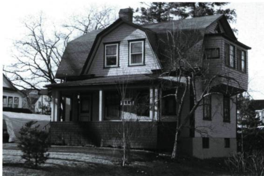
Maison vernaculaire à comble brisé: 125, rue Eastview, Cookshire. Photo: Richard Milot, 1988.

La maison de Cookshire est coiffée d'un toit à comble brisé à l'américaine. De plus, les versants affichent une brisure au centre formant deux brisis égaux. La popularité de ce type de toit vient de la