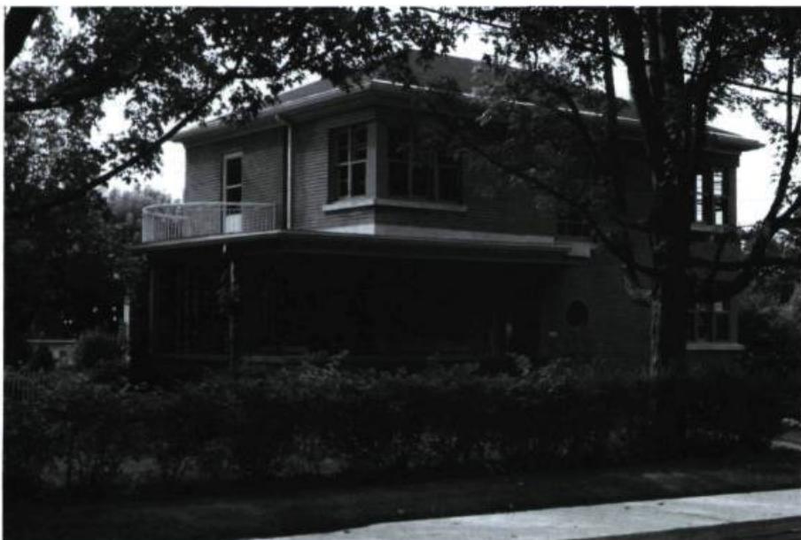
Maison vernaculaire moderne: 441, rue Ontario, Sherbrooke. Photo: Richard Milot, 1988.

La maison vernaculaire dans les Cantons-de-l'Est témoigne somme toute du développement culturel de l'Amérique du Nord. La richesse de son patrimoine bâti intègre l'Estrie actuelle dans cette aire culturelle. Cette richesse n'est pas nécessairement synonyme de somptuosité et d'extravagance. Il faut sans aucun doute y voir la richesse de l'humble demeure dans son concept rationnel visant le confort des résidents, dans son effort de normalisation industrielle et aussi dans l'harmonie de ses éléments décoratifs.