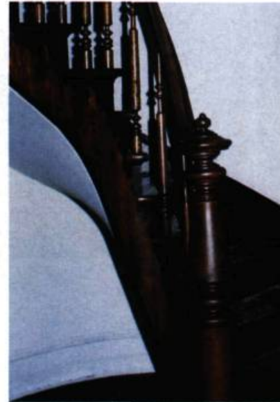
Bel escalier tournant qui accomplit un retour complet sur lui-même.

En plan, les escaliers adoptent différents patrons. Ainsi, l'escalier en équerre a un seul retour à 90 degrés; il comporte une seule volée à quartier tournant, c'est-à-dire que certaines marches rayonnantes tournent autour du noyau ou du mur-noyau pour faciliter le changement de direction. L'escalier tournant accomplit au moins un retour complet sur lui-même (180 degrés); il est alors tournant à gauche ou à droite. Il existe deux types d'escaliers tournants: l'escalier avec retours et l'escalier à vis, composé uniquement de marches dites gironnées. Dans ce cas, les marches s'apparentent à des marches rayonnantes, car leur profondeur est plus étroite d'un côté. L'escalier appelé rampe-sur-rampe correspond à un escalier tournant à retours; les volées droites se superposent dans l'espace et ne laissent aucun jour au centre. Parfois, pour compenser le