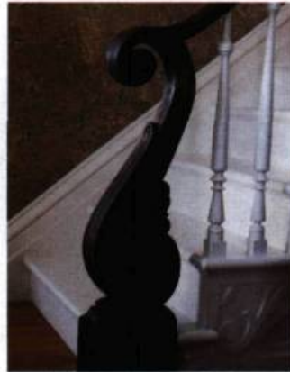
Poteau de départ finement ouvragé, caractéristique du début du XIX e siècle dont le décor sculpté reproduit des motifs appréciés à l'époque.

Aux XVII e et XVIII e siècles, les bois mous (comme le pin) sont davantage employés; toutefois, dans les plus grandes demeures, on a recours au bois du chêne. À l'occasion, une