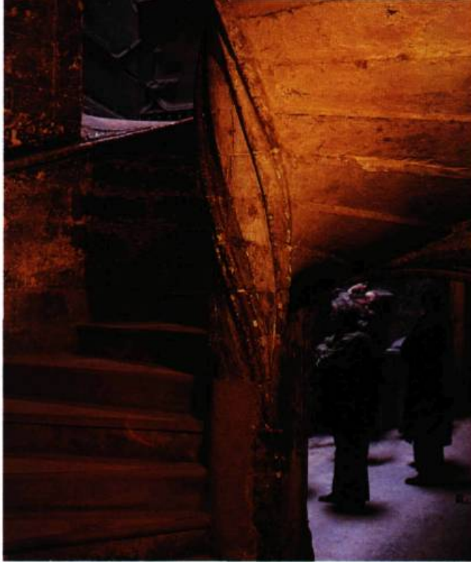
Bel escalier à vis, en pierre, d'une habitation du XVI e siècle dans le Vieux-Lyon en France.