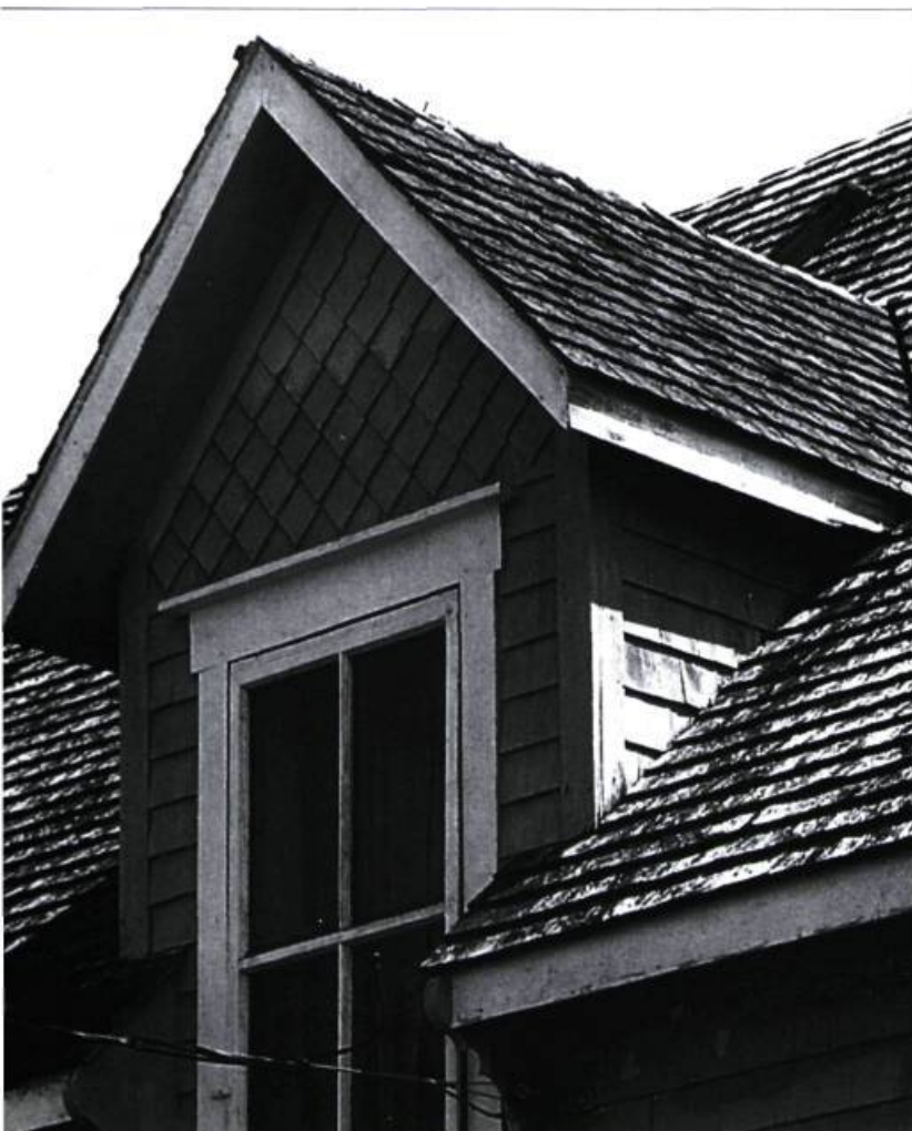
Aspect général d'un pan de toiture exposé au soleil : la surface extérieure des bardeaux mal taillés sèche plus rapidement, et ces derniers se courbent.