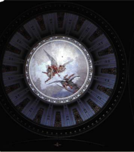
La fresque de la coupole de la chapelle des Ursulines est une œuvre de Luigi Capello, peinte vers 1897.