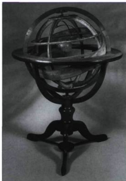
Une sphère armillaire datant de 1832.