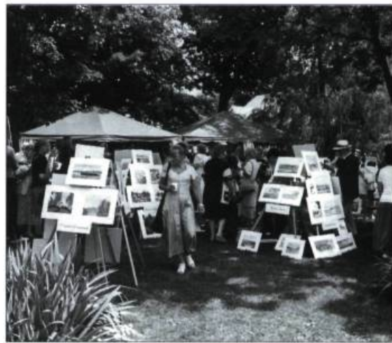
Une foule importante se pressait à Saint-Michel-de-Bellechasse à l'occasion de l'édition 1998 de l'Art en Fête.

Le 2 août dernier s'est tenue à Saint-Michel-de-Bellechasse la première édition de l'Art en Fête. Plus d'une quarantaine d'aquarellistes ont exposé leurs œuvres représentant différents traits patrimoniaux et touristiques de Saint-Michel. Pas moins de 2500 personnes ont participé à cet événement qui devrait se répéter l'an prochain. À Saint-Michel-de-Bellechasse, comme dans plusieurs autres villes et villages du Québec, la mise en valeur du patrimoine bâti ainsi que la promotion des arts et de la culture font désormais partie intégrante du produit touristique culturel. Ce vieux bourg, datant du Régime français et situé dans un cadre naturel enchanteur, est en voie de devenir l'exemple parfait de la conjonction nature et culture.