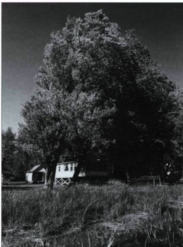
Chalets et maisons sur pilotis font partie du patrimoine local. C'est d'ailleurs sur l'Îlette au Pé que Germaine Guèvremont, l'auteure du Survenant, a passé les 11 derniers étés de sa vie.