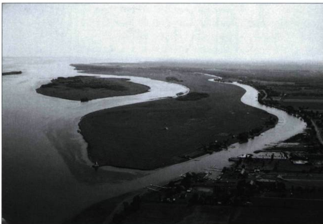
Avec son archipel de 103 îles, le lac Saint-Pierre est l'une des composantes majeures de l'écosystème du Saint-Laurent. On aperçoit ici l'archipel des îles de Sorel.