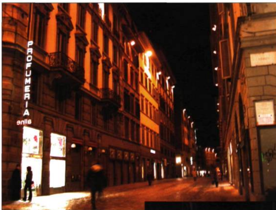
Deux vues des rues du centre historique de Florence en Italie. En bas, l'éclairage traditionnel provoque de la pollution lumineuse, éblouit et nuit à la lisibilité des façades des palais. En haut, l'éclairage qualitatif met en valeur l'architecture et n'engendre aucune pollution lumineuse.

Les critères de sélection des espaces à mettre en lumière devraient être établis en fonction d'une connaissance approfondie de la morphologie de la ville, de son évolution à travers l'histoire, et de tous les lieux, objets et traces qui persistent à travers le changement. Les choix devraient également se porter sur les lieux publics considérés collectivement comme les