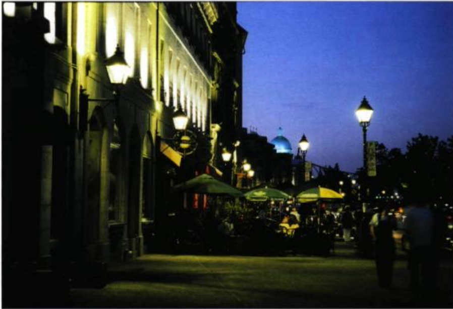
La rue de la Commune.