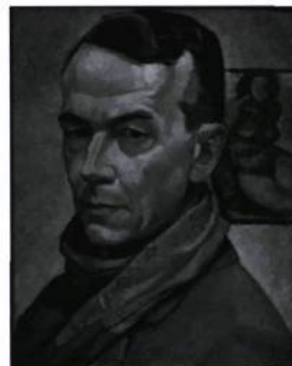
Autoportrait d'Edwin Holgate, huile sur panneau, 41 x 31,6 cm, 1934.

Du 26 mai au 23 octobre, le Musée des beaux-arts de Montréal présente l'exposition rétrospective « Edwin Holgate ». Cet artiste qui fut le huitième membre du Groupe des Sept est considéré comme une figure majeure de la communauté artistique montréalaise et de l'histoire de l'art canadien. L'exposition, une première depuis son décès en 1977, réunira 145 tableaux, dessins, aquarelles, estampes, illustrations de livres et photographies d'archives. Elle traitera de plusieurs aspects de sa production artistique: ses premières œuvres réalisées à Montréal, sa formation à Paris, les portraits de sa famille et de son cercle d'amis, les tableaux et gravures réalisés lors de son voyage en Colombie-Britannique et ses dessins et tableaux d'artiste militaire. Montréal. Information : (514) 285-1600 ou www.mbam.qc.ca