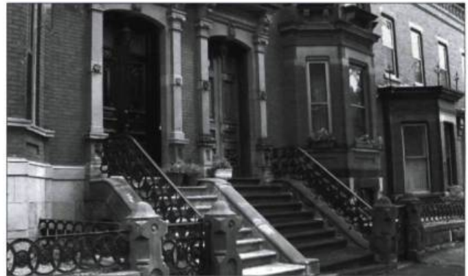
Belles demeures de la rue Germain à Saint John au Nouveau-Brunswick. On en a préservé les entrées et les éléments fonctionnels et décoratifs, qui s'avèrent importants pour définir la valeur patrimoniale de ces maisons.

Ève Wertheimer travaille à la Direction pour la conservation du patrimoine au ministère des Travaux publics et des Services gouvernementaux.