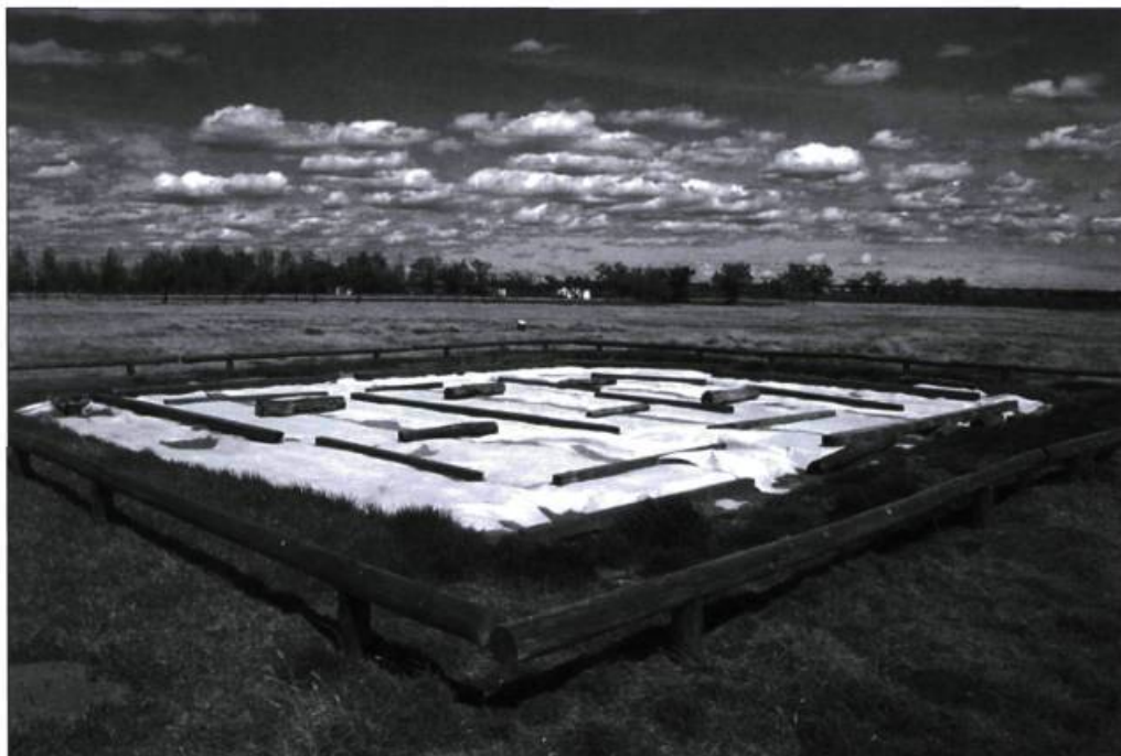
À Fort Battleford en Saskatchewan, une mise en protection du site archéologique a été assurée avant l'étape des fouilles. Feuilles de plastique sur le sol et petite clôture ont limité l'accès au site de façon temporaire et l'ont protégé des perturbations éventuelles.