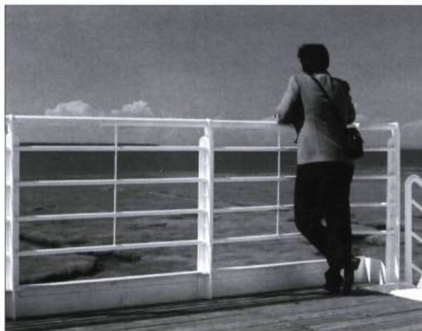
Observer le mouvement des marées ou la faune ailée est devenu une activité des promeneurs.

■ Aline Blais est responsable des communications à la Ville de Rimouski et Alain Tessier y est responsable de l'urbanisme.