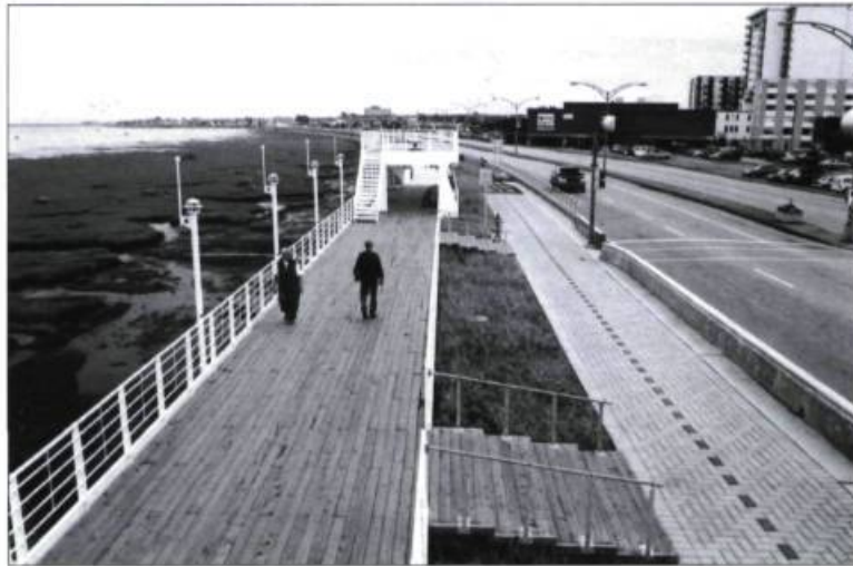
La promenade de la Mer sert de lien entre les tronçons est et ouest de la Route verte.

L'achalandage et les commentaires reçus confirment le grand succès de cette réalisation, rendue possible grâce à une étroite collaboration entre plusieurs personnes et intervenants, notamment le personnel de la Ville, le ministère des Transports du Québec, qui a fait les plans du mur et l'a ensuite conçu, la firme Pluram urbaticque, qui a réalisé le concept et le plan d'amé-