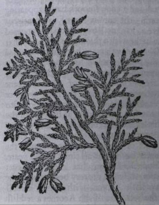
Une des illustrations qui venaient renforcer l'idée que l'arbre de vie était bel et bien le Thuja occidentalis . Elle provient d'un ouvrage publié en 1633.

Ill.: tirée de The Herball de John Gerard