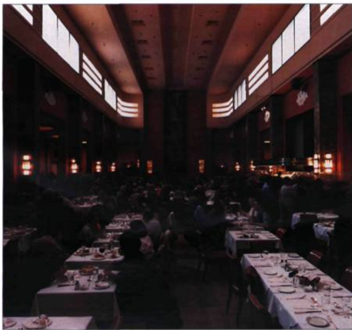
Véritable bijou d'Art déco, le restaurant de L'Île-de-France, situé au neuvième étage du défunt Eaton, à Montréal, a été classé monument historique en 2000. Fermé depuis 1999, il est dans l'attente d'une nouvelle vocation qui collera à son histoire et à ses caractéristiques.