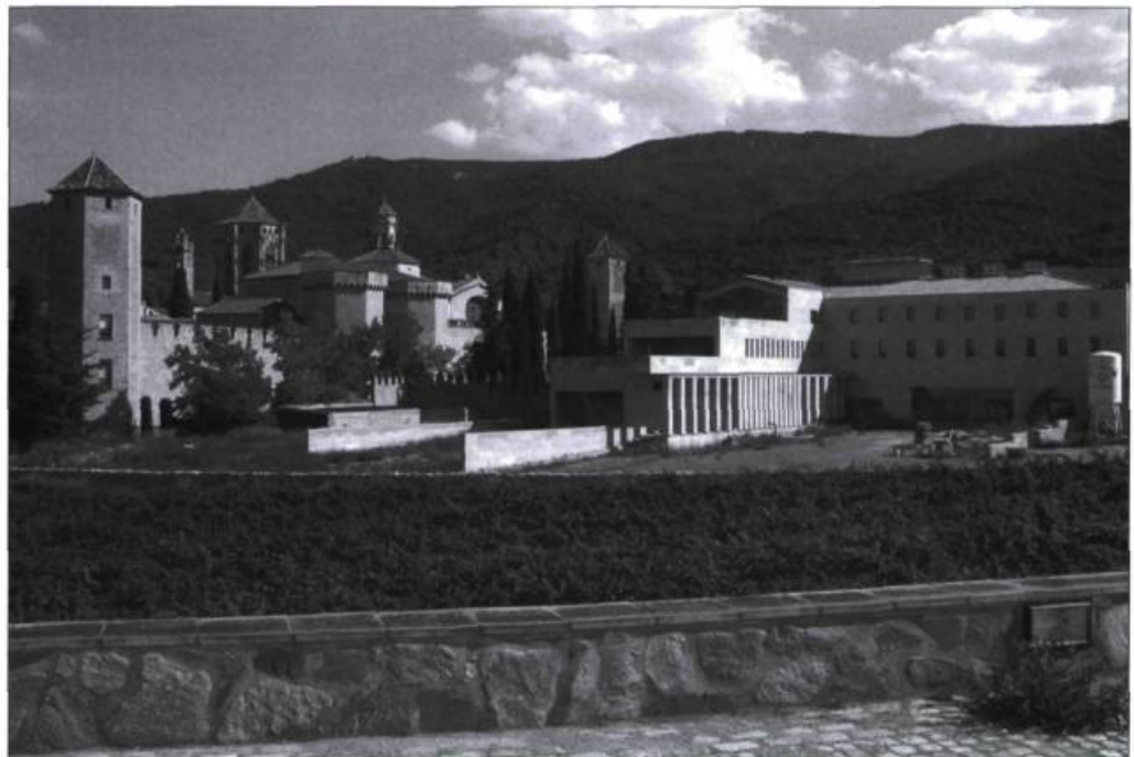
Le monastère de Poblet, situé à une heure de Barcelone, a été remis en état et animé avec le concours d'une communauté de moines cisterciens et de l'État. À droite, l'hôtellerie moderne, très bien intégrée à l'ensemble.