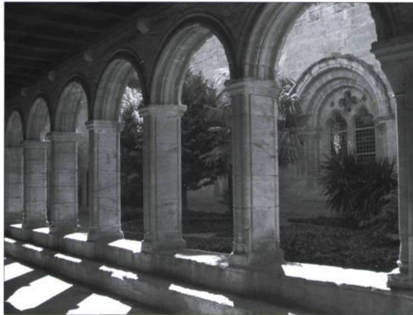
La cour intérieure du monastère de Poblet. L'établissement accueille près de 200 000 visiteurs chaque année.