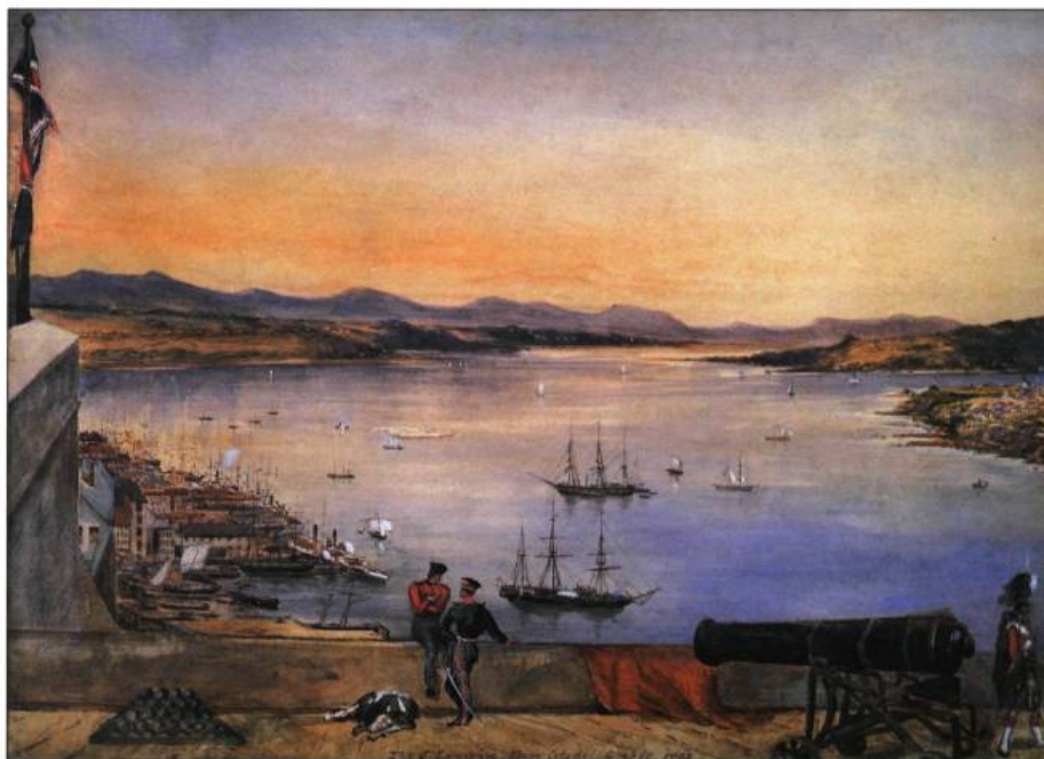
Aquarelle intitulée La Basse-ville de Québec et le Saint-Laurent vus de la Citadelle , réalisée par Francis A. Fane en 1853.

1759. Québec devient la capitale d'une colonie anglaise. Le fleuve est à l'avant-plan