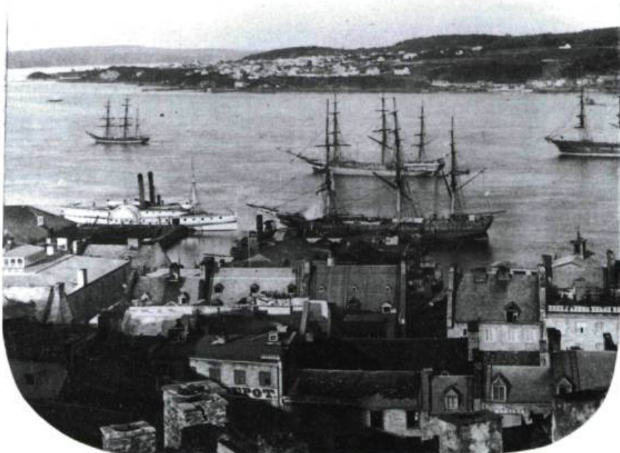
Cette photographie prise vers 1860 témoigne de l'activité maritime entre la basse-ville de Québec, l'anse aux Sauvages et l'île d'Orléans.

■ Serge Pallascio est journaliste culturel.