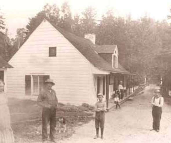
Jusqu'en 1913, la Maison Déry a accueilli des pêcheurs de passage.