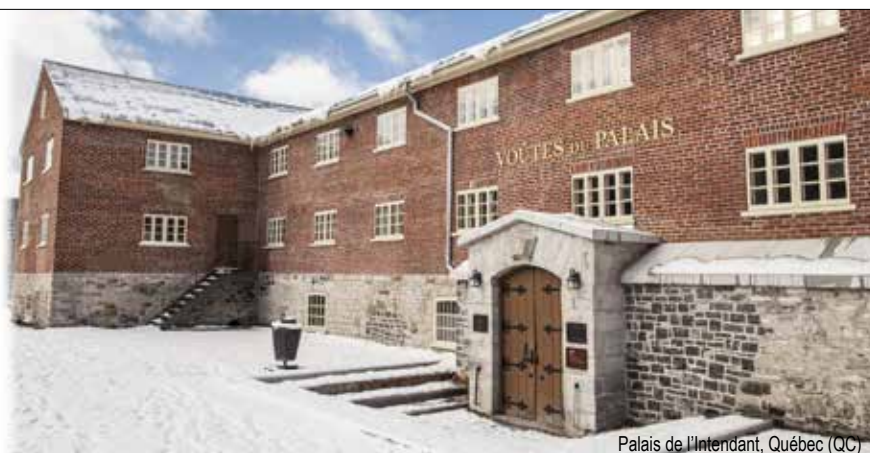
Palais de l'Intendant, Québec (QC)

810, Saint-Joseph Est Québec Québec Canada G1K 3C9 t. (418) 694. 6911 f. (418) 694. 0833 bfarchitectes.com