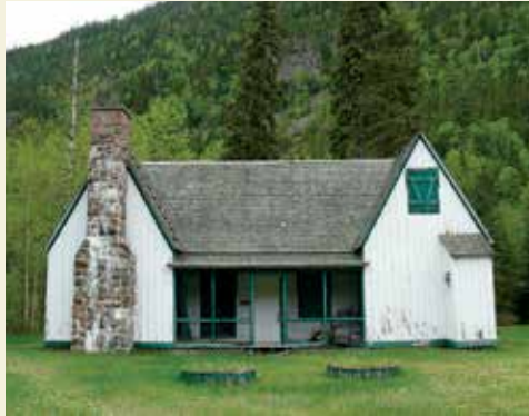
Chalet principal d’architecture pittoresque du site de pêche de la pointe de Bardsville