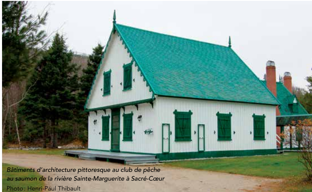
Bâtiments d'architecture pittoresque au club de pêche au saumon de la rivière Sainte-Marguerite à Sacré-Cœur