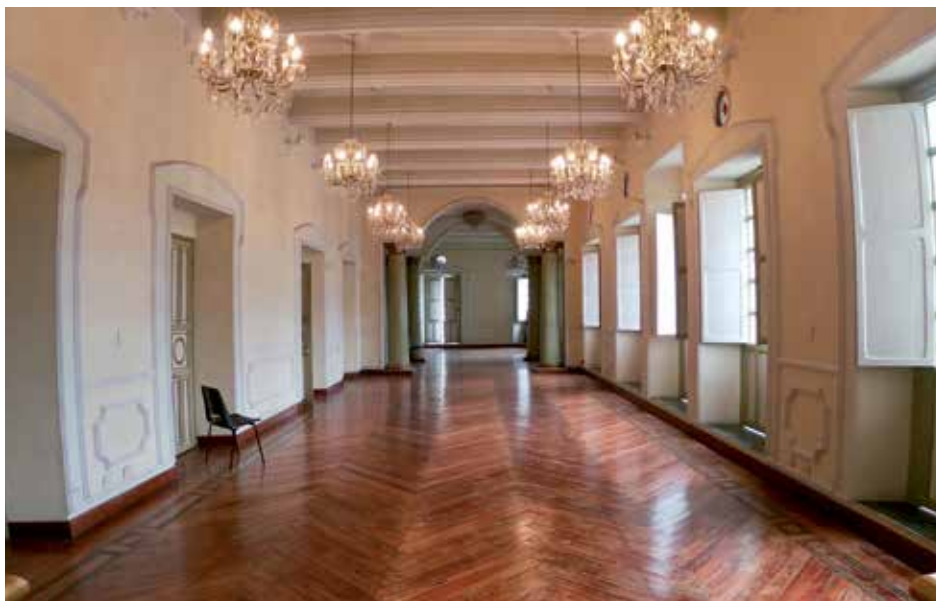
Tantôt, les intérieurs affichent des détails monochromes finement travaillés, comme dans ce théâtre de Popayán; tantôt, ils prennent des couleurs éclatantes.

Dans les villes tentaculaires comme dans les villages haut perchés, l'architecture coloniale caractérise les édifices situés à proximité des places centrales et de leurs majestueuses églises. Des matériaux de proximité (torchis, cannes tressées, bambous, tuiles d'argile, pierres taillées ou débris d'argile et de moellons recouverts d'enduit) composent les bâtiments. Certaines constructions sont peintes de couleurs vives (comme à Salento et à Filandia, dans la vallée de Quindío), d'autres sont enduites de chaux (comme à Popayán, capitale de la vallée du Cauca surnommée