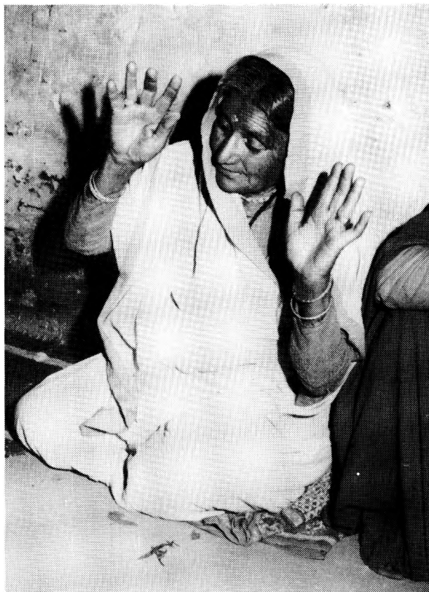
Médium en état de transe.

Le dieu qui a investi le corps du médium fait ensuite la distribution de cendres sacrées. Tout le monde en prend, car ces cendres sont censées être très bénéfiques. L'attention de la foule est alors à son maximum. Ceux qui reçoivent des cendres sont agenouillés et recueillis. Ils se concentrent sur le contact direct et physique qu'ils ont avec le sacré. Puis, par l'intermédiaire de la bouche du médium, le dieu s'adresse à la foule. Durant son discours, l'attention de l'assemblée se relâche un peu. Certaines personnes interrogent le dieu. Si ce dernier le demande, le jāgar terminera le lendemain matin