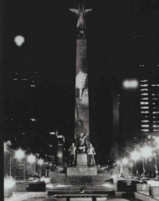
Krzysztof Wodiczko, projection publique au South African War Memorial, Toronto, 1983, organisée par la Ydessa Art Foundation, Toronto, reproduite avec l'aimable permission de la Galerie Lelong, New York.