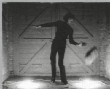
Bas Jan Ader, Nightfall , 1971, film 16 mm transféré sur DVD, 4 minutes 10 secondes