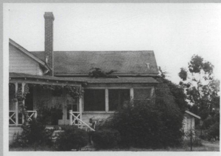
Bas Jan Ader, Fall II , Amsterdam, 1970, film 16 mm transféré sur DVD, 25 secondes

On connaît la suite. La biographie de Bas Jan Ader nous renvoie à ce zéro insupportable et originaire de l'accident. Parti de Cape Cod, l'artiste entreprend en 1975 en solitaire la traversée de l'Atlantique. Un