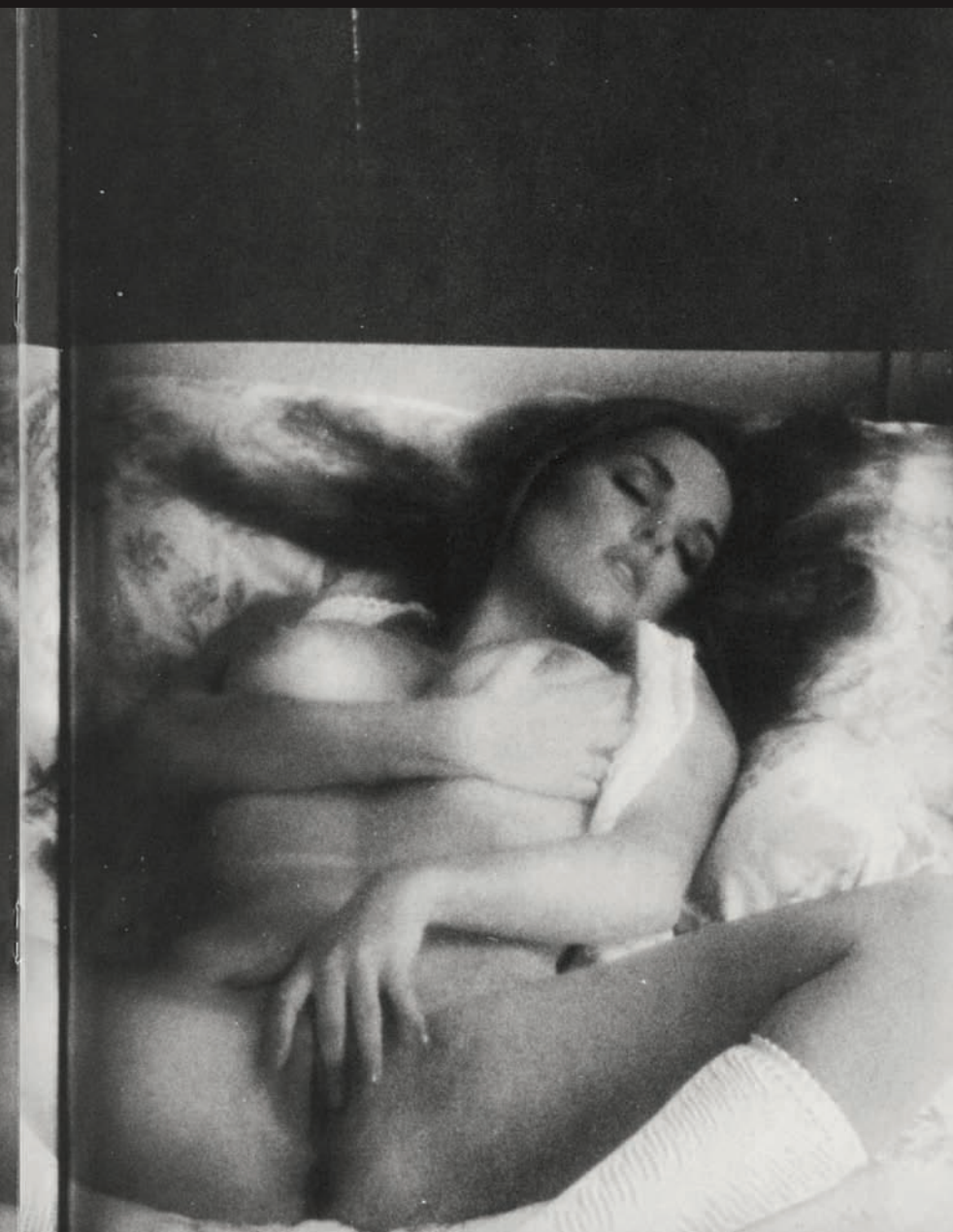
Michael Snow, Repeat Offender , photographie, Photo Communiqué , fall / automne 1986.