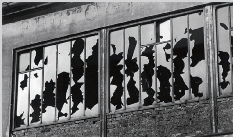
Brassaï, Sans titre , vitres cassées d'un atelier de photographe, c. 1934, épreuve argentique, 17,3 x 29,8 cm, Musée Folkwang, Essen © Succession Brassaï / RMN

Quelque vingt-cinq ans après Explosante fixe . Photographie et surréalisme , exposition conçue en 1985 par Rosalind Krauss et Jane Livingston, le Fotomuseum Winterthur présente une exposition 1 d'envergure qui entend recenser et analyser les diverses fonctions assignées par les surréalistes aux images indicielles. À l'aide de plus de 400 œuvres plastiques, une dizaine de films et une centaine de documents, distribués suivant neuf sections thématiques, l'exposition rassemble les travaux de ces figures de proue du mouvement que sont Man Ray, Kertesz et compagnie, mais présente aussi des œuvres moins connues – envoûtantes mises en scène photographiques d'Artaud, par