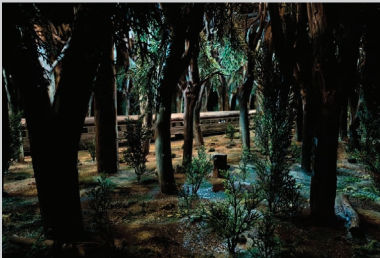
David Hoffos, Scenes from the House Dream: C.P. Fail (detail), 2008, installation

The soothing, immersive atmosphere that Hoffos creates for his work sets it apart from Tony Oursler's disturbing spectacles and Wyn Geleynse's discreet constructions, though these artists too, project moving characters onto constructed models. The total enclosure of Scenes from the House Dream allows for a withdrawal from