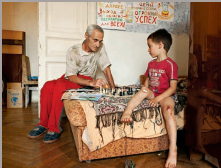
Chess with Grandson, 2011, épreuve chromogénique, 100 x 134 cm

Dans cette exposition, Hannah poursuit sa série des Stills , son corpus de travail le plus important, dans laquelle il s'intéresse à ce qui subsiste de la vidéo lorsqu'elle est dépourvue de son et de mouvement. Il en