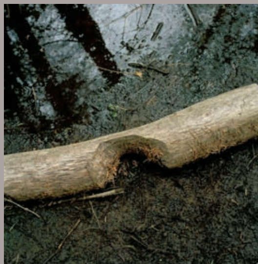
Comme un murmure (suite) No.21, 2008, jet print on archival paper on aluminum, 64 x 64 cm

Within Australian Aborigine cultures, the walkabout was a common rite of passage for young boys as they transitioned into manhood that involved their meandering over large and unknown territories. The idea was to walk aimlessly, often for months, guided not by logic or the conscious mind but by the pull of ancestry and spiritual guidance. I see in Rajotte's method a parallel learning experience, in which he has sought