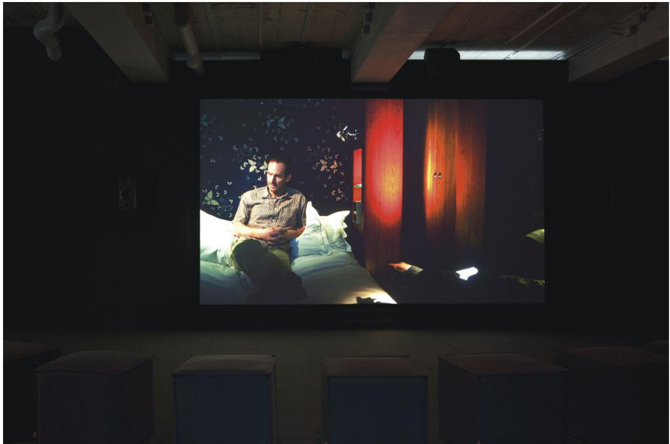
Omer Fast, 5000 Feet Is the Best , 2011, film numérique / digital film, boucle de 30 min / 30 min. loop