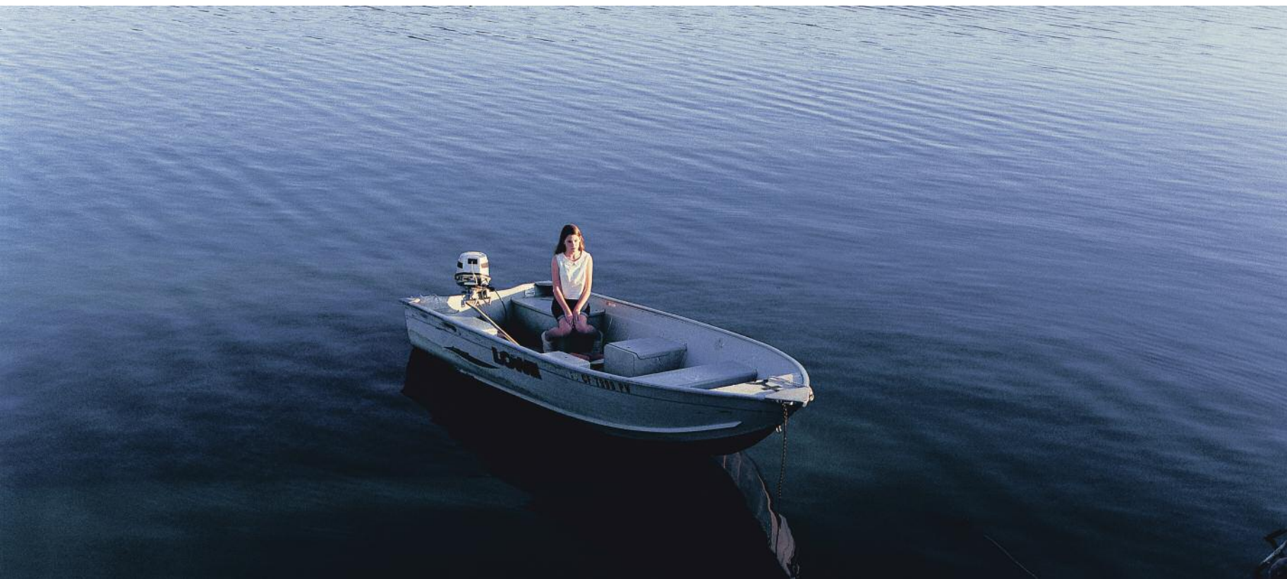
Philippe Parreno, June 8, 1968 , 2009, 70 mm film, 7, 11 min, permission de /courtesy of Pilar Corrias Ltd

œuvres sèches, didactiques ou illisibles. Ici, ce n'est jamais le cas, les artistes choisis ayant tous un sens développé du récit, de la synthèse et de la poésie. Leurs œuvres, visant à mettre au jour les fondements humains et se situant dans la perspective d'une re-création, atteignent même une dimension mythique.