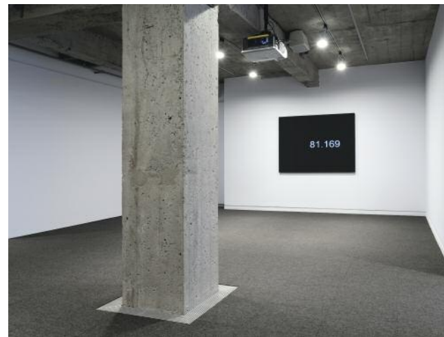
José Toirac, Opus , 2005, vue de l'installation / installation view (video)

A sense of derealization is also distilled in the masterful work by Taryn Simon, An American Index of the Hidden and Unfamiliar (2007), of which nineteen photographs accompanied by texts are presented (there are seventy in the complete series). In often static, spare, even clinical framings, Simon reveals normally inaccessible places (a cryostasis institute, the room at JFK Airport where organic waste intercepted at customs is collected, a storage facility for nuclear waste, and so on), taboo phenomena (a Braille edition of Playboy , hymenoplasty, and so on), or people in extreme positions (an Oregon man with bone cancer who has legally obtained a prescription for pentobarbital enabling him to commit suicide, a prisoner on death row, and so on). These images are accompanied by enthralling explanatory texts that enable us to both understand the image and situate it in a much