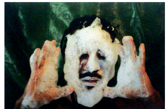
Em'kal Eyongakpa Untitled 1 , de la série / from the series Naked Routes , 2011