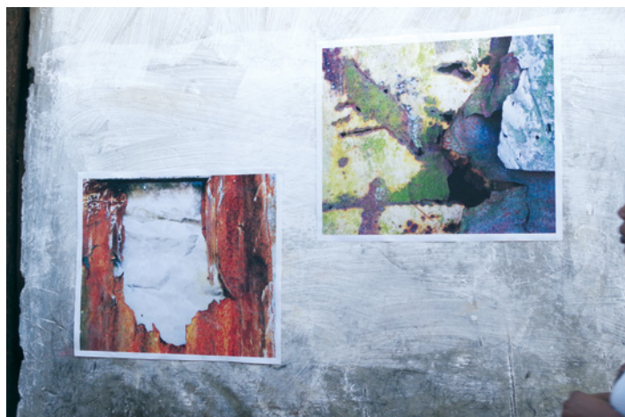
Boris Nzebo de la série / from the series Ville Surprise , n° 10, 2012 photographie et collage / photograph and collage, matériaux divers / various materials 37 cm x 55 cm