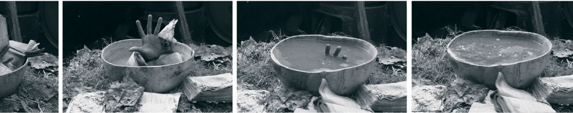
Em'kal Eyongakpa Bleed for the Read Pentaptych , 2009